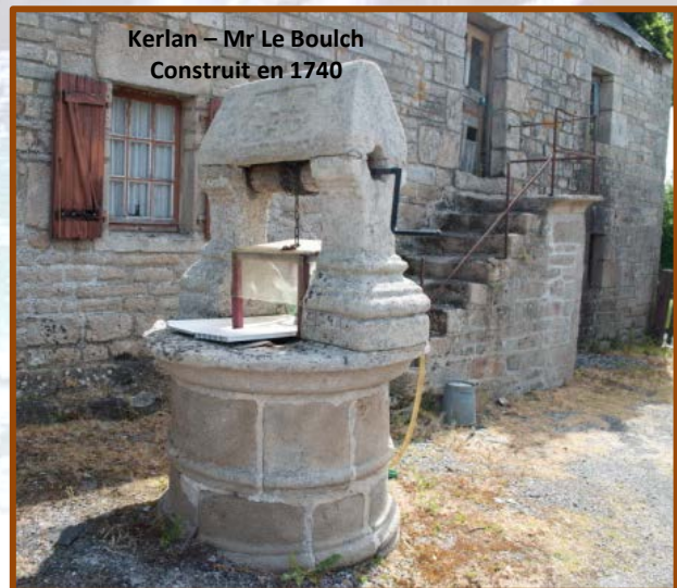
Kerlan – Mr Le Boulch Construit en 1740