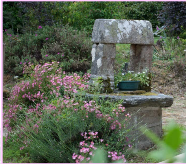
Purit – JF Saint-Jalm Construit en 1695 (ci-dessous)

Vous rencontrerez dans les cours des fermes anciennes de très beaux puits, le plus souvent en granit, avec une potence sculptée.