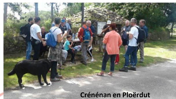
Crénénan en Ploërdut