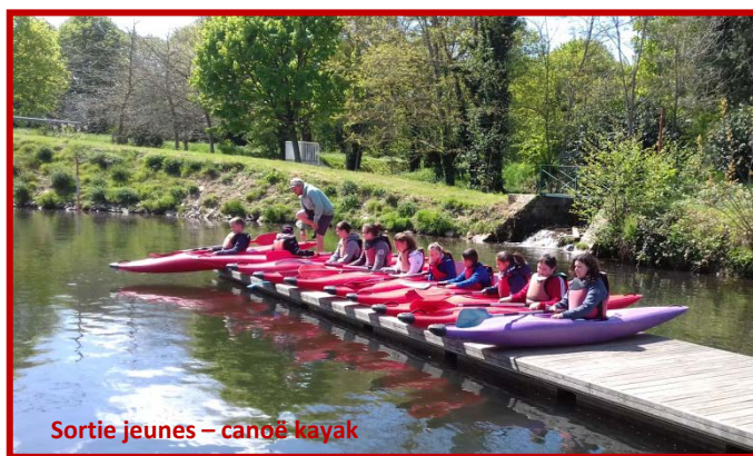
Sortie jeunes – canoë kayak