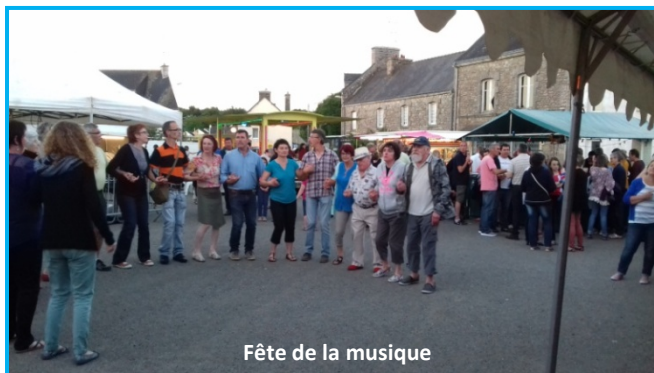
Fête de la musique

Moulin de Pont à Houarn fabriqué par Gilles Perron en 1663