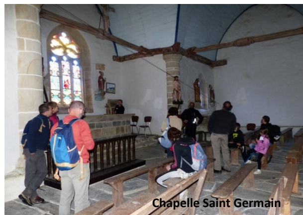
Chapelle Saint Germain