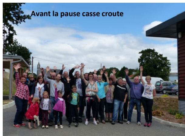
Avant la pause casse croute

L'existence d'événements tels que celui du 1er juillet et la mobilisation des bénévoles sont la preuve du dynamisme de la commune alors pour continuer: rendez-vous le 10 août pour la rando Pourlet."