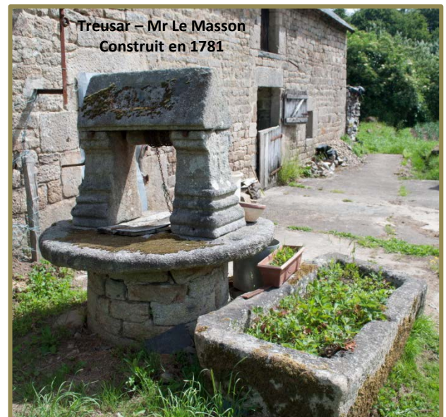
Treusar – Mr Le Masson Construit en 1781