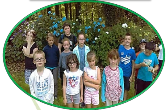
Promenons-nous dans les bois !