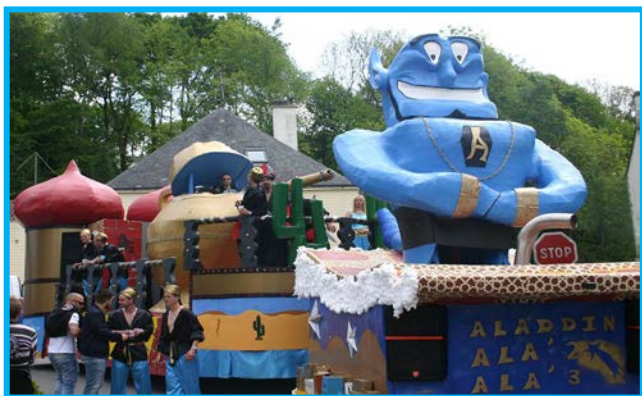
Le char à la cavalcade Pourleth à Guémené-sur-Scorff, dimanche week-end Pentecôte 2016