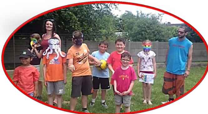
Oh ! Les beaux masques !