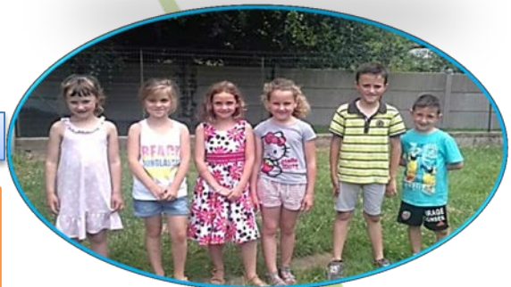
En TAP, on pose pour la photo !

Après l'étude des réponses au questionnaire qui a été soumis aux parents d'élèves, le conseil municipal de Séglien et le conseil d'école ont émis un avis favorable au retour de la semaine à 4 jours dès la rentrée 2017.