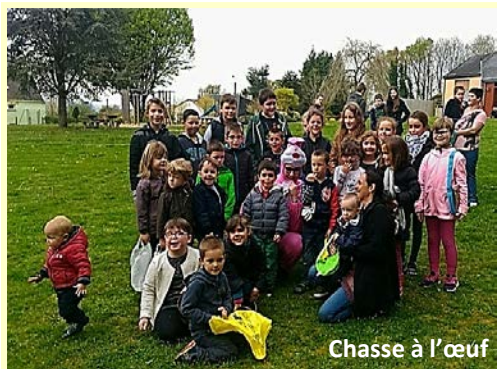
Chasse à l'œuf

Les vacances sont là et l'Amicale Laïque achève son année sur un très bon bilan, afin d'offrir à nos enfants des voyages ainsi que des activités et sorties au sein de l'école.