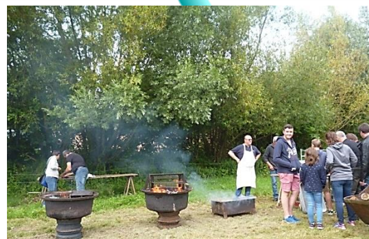
Préparation du repas par les bénévoles