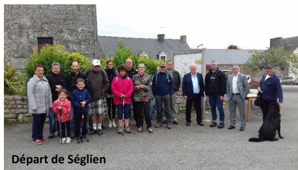
Départ de Séglien

Cette journée a donc été une réussite, le parcours exceptionnel, les conditions météo ainsi que les trois pauses proposées pendant la randonnée ont été très appréciés.