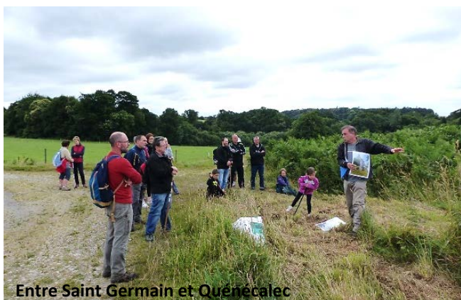
Entre Saint Germain et Quénéalec

Ce type d'événement ne pourrait avoir lieu sans les participations des bénévoles qui entretiennent les sentiers pendant l'année, cette année encore une vingtaine d'habitants de Séglien se sont retrouvés pour travailler et partager un repas en avril et en juin.