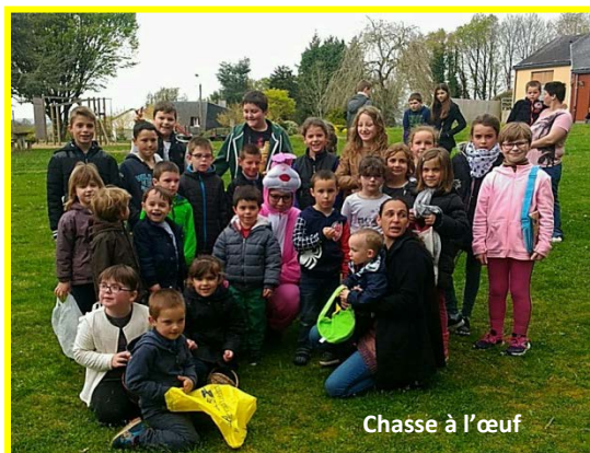
Chasse à l'œuf