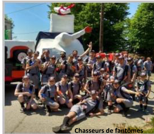
Chasseurs de fantômes