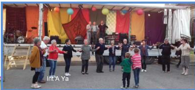
Int A Ya

Une très belle édition encore cette année !