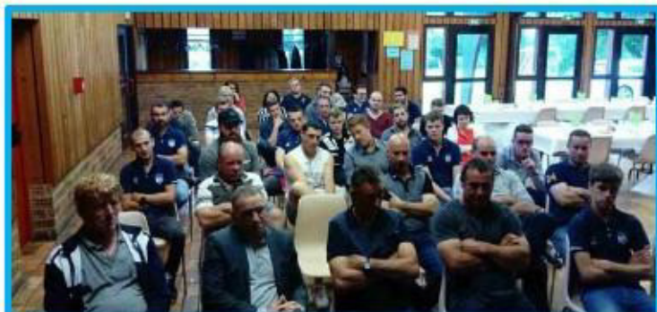
A.G. de l'E.S. Séglien : les membres