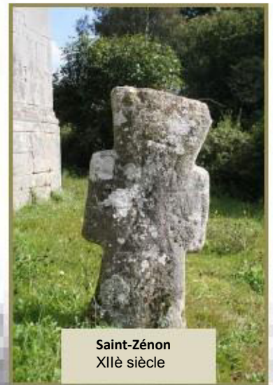
Saint-Zénon XII e siècle

Symbole catholique très répandu du XVI e siècle à nos jours, certaines sont donc d'origines très anciennes, et le monument actuel est proclamé trésor national ou monument historique.