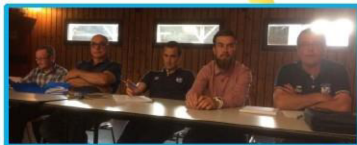
A.G. de l'E.S. Séglien : le bureau