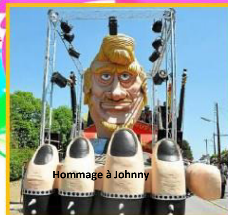
Hommage à Johnny

tous ces jeunes ont fait preuve de beaucoup d'imagination et ont fourni des heures d'un travail acharné.