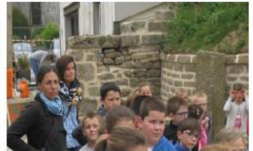
Inauguration du four à pains à Séglien