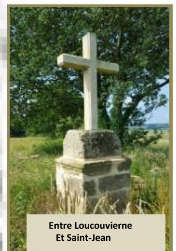
Entre Loucouvierne Et Saint-Jean

En plus de leurs usages religieux, ces croix ont un rôle de guide pour les voyageurs et d'indicateur pour les habitants : quand le croisement est sous la neige, la croix continue d'indiquer leur position.