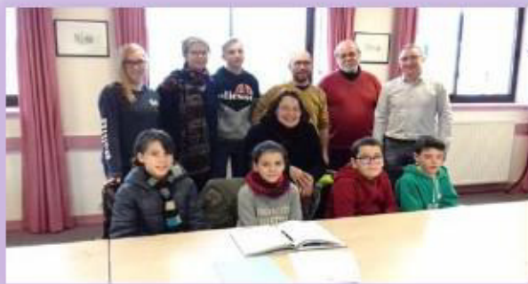
1ère réunion le 3 février 2018

Fin 2017, le pays de Pontivy a lancé un appel à projets intitulé « Jeunesse et Citoyenneté ». Il s'agissait pour les communes souhaitant y répondre que ce soit les jeunes âgés de 10 à 17 ans qui montent un dossier sur un investissement de leur choix dans le domaine de leur choix.