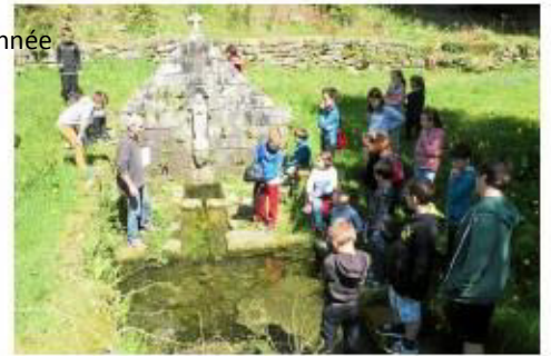
La fontaine aux chevaux : Coët en Fao

Le vendredi 29 juin, les enfants de Séglien se sont rendus à leur tour à Silfiac afin de découvrir le patrimoine de la commune.