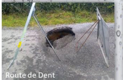
Route de Dent

Diverses interventions par les services techniques lors des inondations