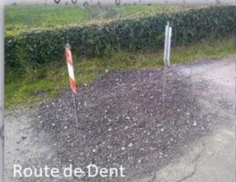
Route de Dent