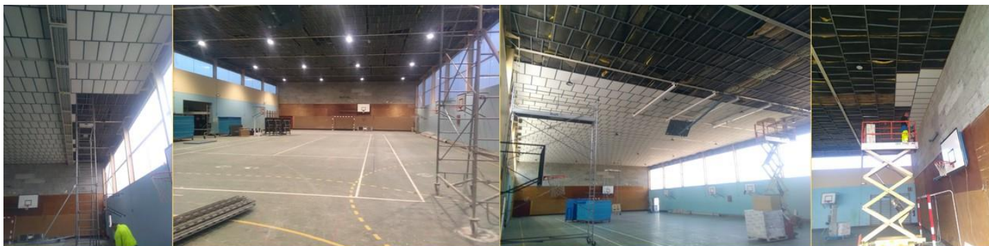
Dépose de l'ancien plafond au gymnase et pose du nouveau ainsi que d'un nouvel éclairage