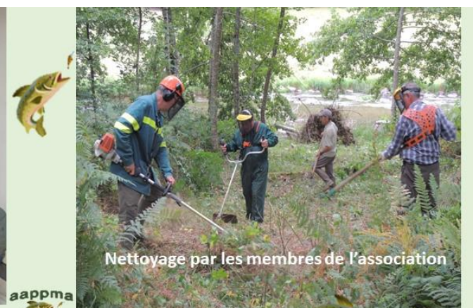
Nettoyage par les membres de l'association