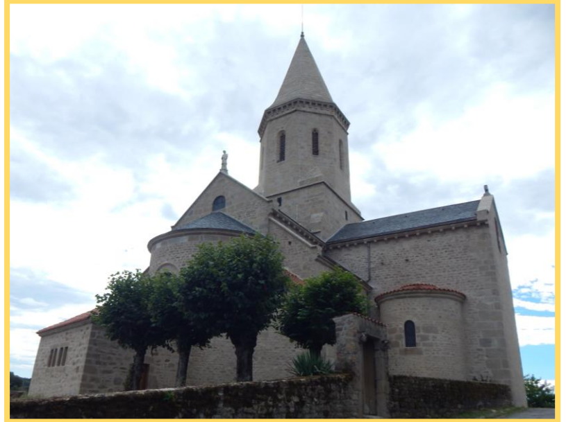
Église Saint Thyrsus rénovée