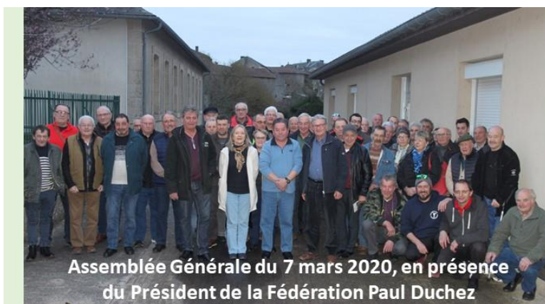
Assemblée Générale du 7 mars 2020, en présence du Président de la Fédération Paul Duchez