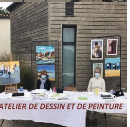
ATELIER DE DESSIN ET DE PEINTURE