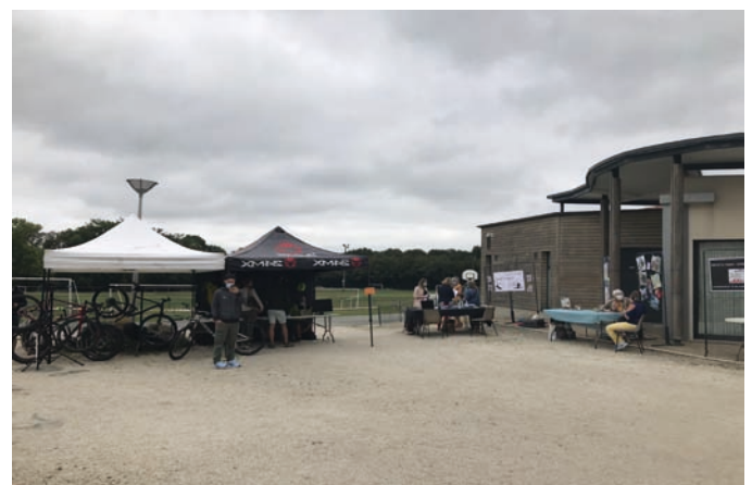
Vue partielle des stands du Forum des Associations