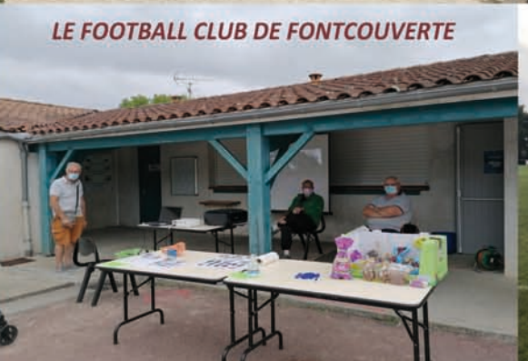
LE FOOTBALL CLUB DE FONTCOUVERTE