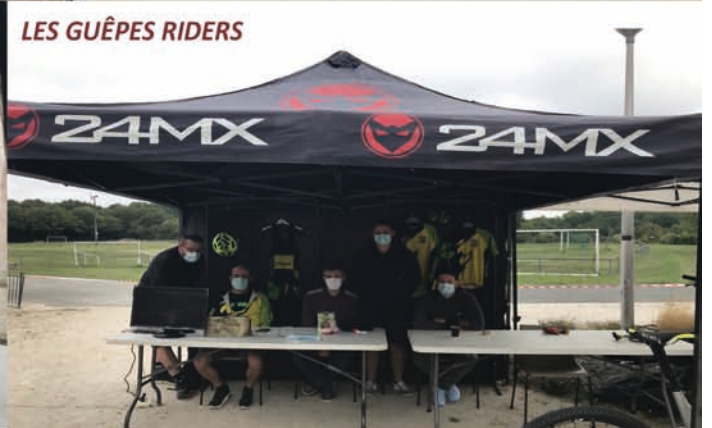
LES GUÊPES RIDERS