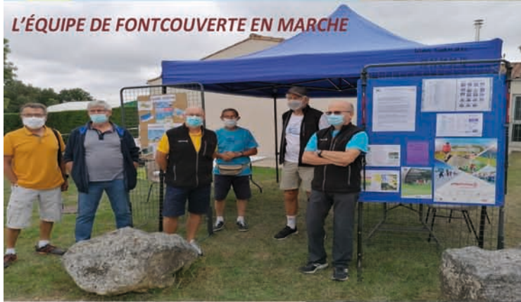
L'ÉQUIPE DE FONTCOUVERTE EN MARCHÉ