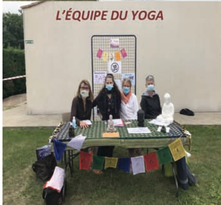
L'ÉQUIPE DU YOGA