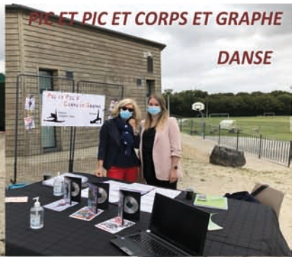
PIC ET PIC ET CORPS ET GRAPHE DANSE