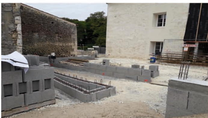
LA RAMPE D'ACCÈS PMR EST MATÉRIALISÉE