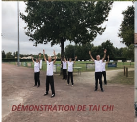
DÉMONSTRATION DE TAI CHI