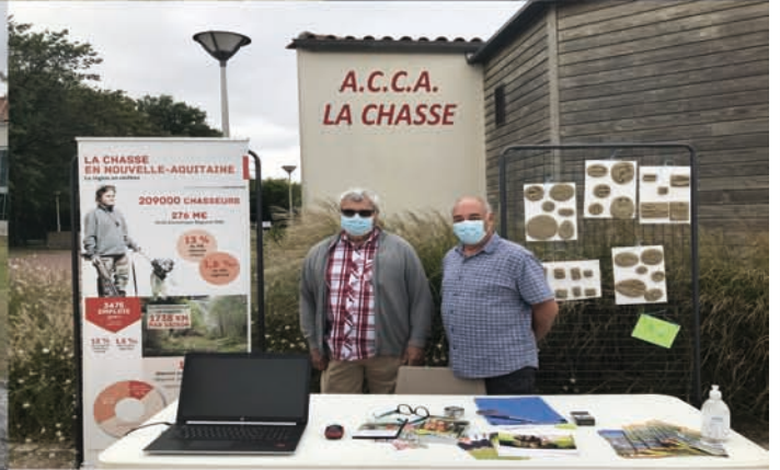
A.C.C.A. LA CHASSE