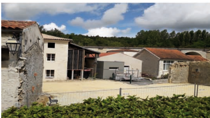
LE SOL EST DAMÉ