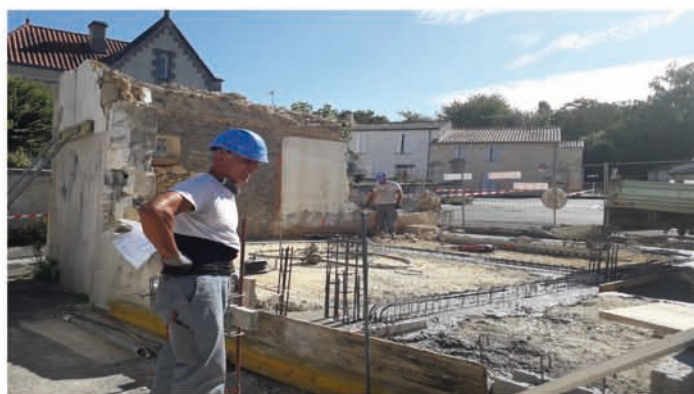
MURETS DE SOUTÈNEMENT POUR JARDINIÈRES