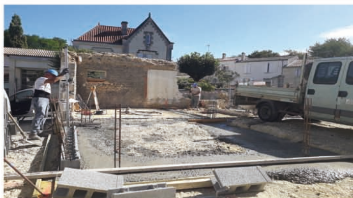
LA CHAPE EST COULÉE