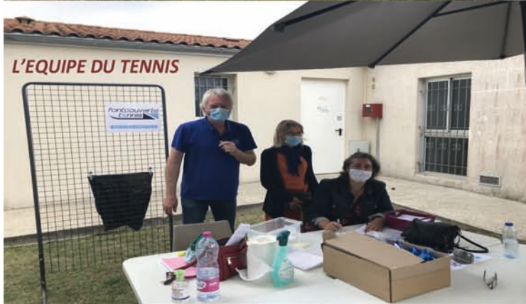
L'ÉQUIPE DU TENNIS