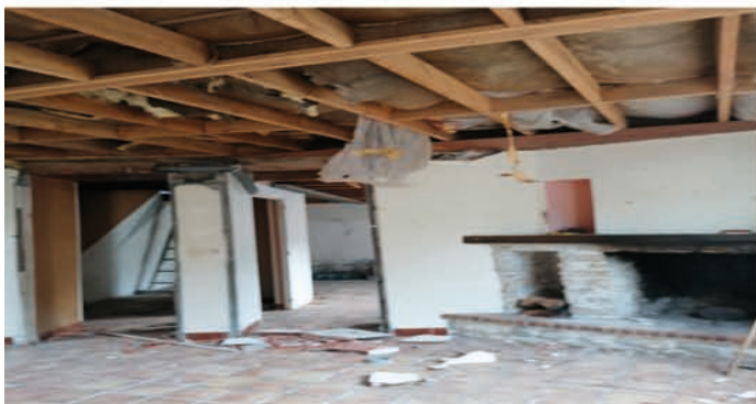
LA DÉMOLITION COMMENCE