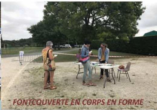
FONTCOUVERTE EN CORPS EN FORME