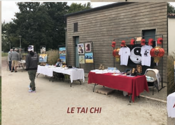
LE TAI CHI