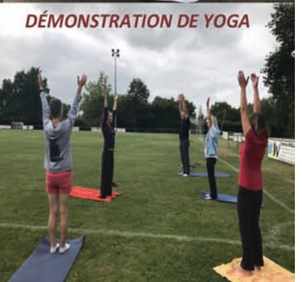
DÉMONSTRATION DE YOGA