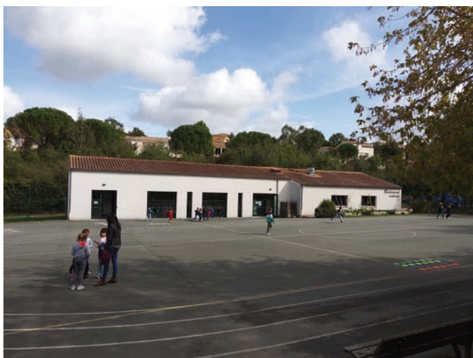
le restaurant scolaire et la cour de récréation de l'école élémentaire

Vous y trouverez également les grilles tarifaires établies selon le quotient familial et les règlements intérieurs .