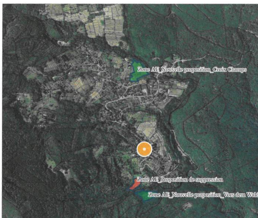
Figure 2 : Propositions zonage AE

Les arguments en faveur de ces modifications sont les suivants :