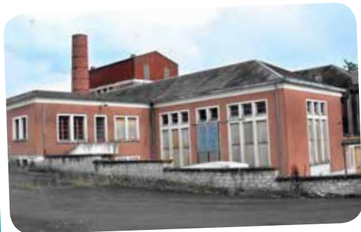
La laiterie en 2006

L'ANCIENNE LAITERIE DU MAZEAU VA SE REFAIRE UNE BEAUTÉ ! Pour cela, elle va bénéficier d'une subvention de 300 000 € de la part de "la MISSION PATRIMOINE" portée par Stéphane BERN !