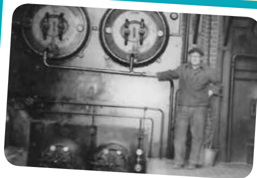
La laiterie en 1949

En effet, des réparations urgentes sont nécessaires pour que le bâtiment retrouve son charme. Les travaux de restauration sont estimés à 1,2 millions d'euros. Il faut déjà compter plus de 600 000 € pour rénover le bâti. Le début du chantier est prévu dès l'été prochain, pour, dans un premier temps, effectuer une mise hors d'eau avec un bâchage provisoire, une partie de la toiture ayant subi d'importantes dégradations.