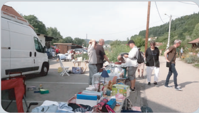
Dès le matin le vide-grenier a fait le bonheur des chineurs

Le Comité des fêtes a rassemblé les Associations du village pour proposer aux visiteurs une journée dans la bonne humeur des retrouvailles à l'occasion de la fête de notre village.