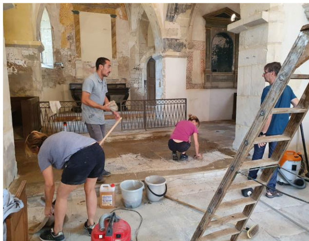
Nettoyage de l'église