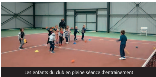
Les enfants du club en pleine séance d'entraînement

Le Tennis club coursacois a repris les entrainements durant quelques semaines. Il a proposé un mini stage pour les enfants du club, heureux de pouvoir partager un goûter de Noël tous ensemble ! Le traditionnel tournoi adultes se déroulera, espérons-le, du 26 juin au 10 juillet 2021.