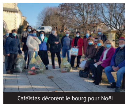
Caféistes décorent le bourg pour Noël

Enfin, une bonne nouvelle pour 2021 : la MSA Dordogne et la Fondation de France s'associent à leurs projets, une belle preuve de solidarité !