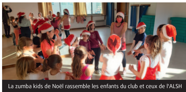
La zumba kids de Noël rassemble les enfants du club et ceux de l'ALSH

Depuis, les dernières mesures sanitaires ne permettant pas l'accès à la salle de danse, Vital Tonic utilise le city stade pour pratiquer la zumba. Rien ne les arrête !