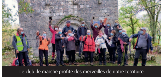
Le club de marche profite des merveilles de notre territoire

Les référents des divers ateliers ont fait le bilan de l'année écoulée marquée par une réduction importante des animations. Toutefois, certains ont eu la possibilité de reprendre leurs activités en plein air.