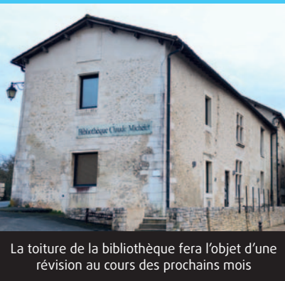
La toiture de la bibliothèque fera l'objet d'une révision au cours des prochains mois

La voirie représente un enjeu majeur pour la commune car elle doit permettre des déplacements sûrs et faciles dans un environnement maîtrisé comportant des aménagements sécurisés.