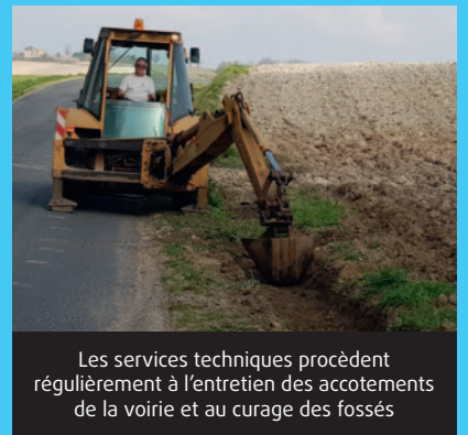
Les services techniques procèdent régulièrement à l'entretien des accotements de la voirie et au curage des fossés

Le plan biennuel de rénovation de la voirie mobilisera pour 2021 près de 70 000 € et permettra des interventions dans plusieurs secteurs de la commune : route de Baillou, route de Guillaumias, mais aussi routes de Coupe Gorge, du petit Moulin, des Brujoux, de la Fontaine des Privats, du Vignaud, et de Broussas.