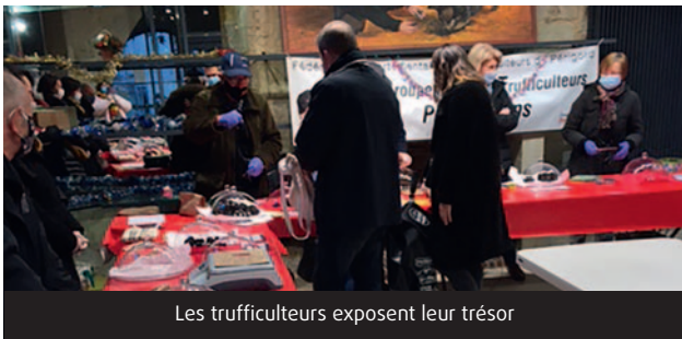
Les trufficulteurs exposent leur trésor

Cette dynamique association coursacoise a pu organiser, comme l'an dernier, ses traditionnels marchés sur Périgueux dans l'ancienne Maison du Pâtissier Place Saint-Louis.