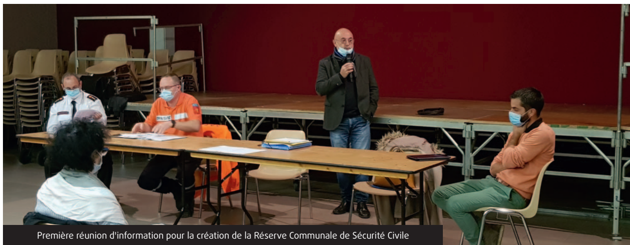
Première réunion d'information pour la création de la Réserve Communale de Sécurité Civile

Coursac se tient prêt à assurer l'information et la protection de la population en constituant une Réserve Communale de Sécurité Civile.