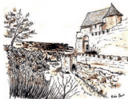
Février : Nicolas Charrier a exposé ses dessins à l'encre

Le biblio-drive (retrait de documents) mis en place pendant les confinements peut encore être utilisé en cas de besoin. Vous pouvez prendre contact avec le service par téléphone au 05 53 07 89 10 , par mail à bibliotheque@coursac.fr ou en passant à la bibliothèque.