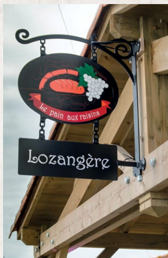
◀ Restauration du four à pain de la Lozangère en 2015