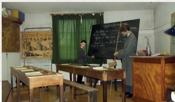
Exposition « Mouzillon en 1914 » en 2016 ▼