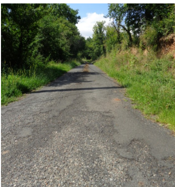
Chemin de la Forêt avant réfection.

Le nouveau conseil municipal a acté pour 2014 le choix du précédent conseil.