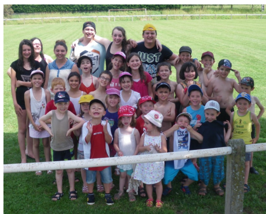
Les enfants et animateurs de l'ALSH « Les P'tits Loups » de Dénat, été 2014

Les bénévoles de l'association Familles Rurales souhaitent à tous une bonne rentrée !