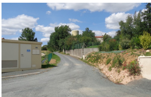
Chemin de Coustette avant réfection.

Ces travaux ont été réalisés courant juin.