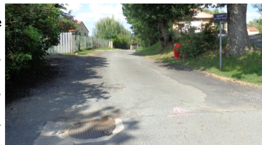
Chemin du Petit Bois avant réfection.