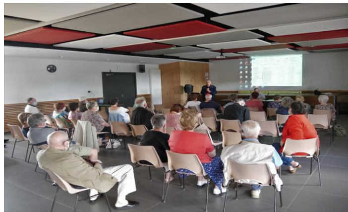
Projection du DVD, en août dernier

Suspendue à l'évolution de la crise sanitaire, la reprise de nos activités est très attendue par tous.