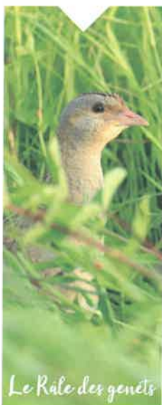
Le Râle des genêts