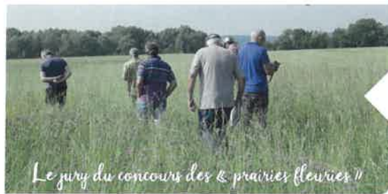
Le jury du concours des « prairies fleuries »