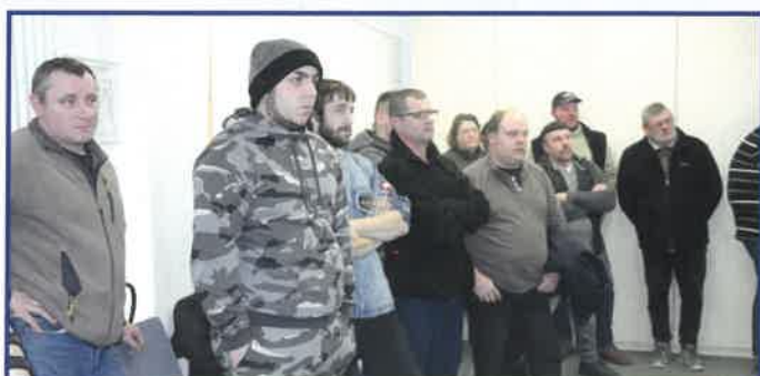
Photos des vœux aux personnels