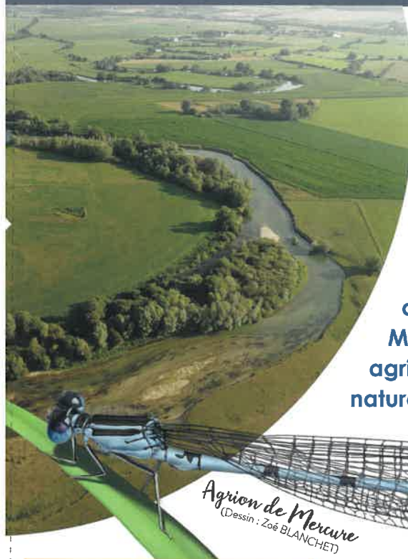
Agrion de Mercure (Dessin : Zoé BLANCHET)