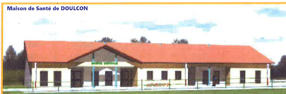
Maison de Santé de DOULCON

En attendant cette ouverture, un cabinet médical va voir le jour dans l'ancienne mairie de Doulcon, il devrait ouvrir au plus tard le 2 octobre 2017.