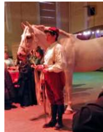
Manège de Tilly

Le 18 décembre : Repas de Noël à Grainville.