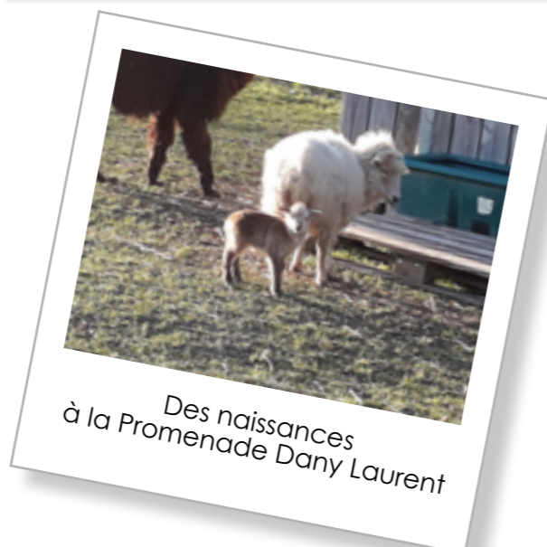
Des naissances à la Promenade Dany Laurent