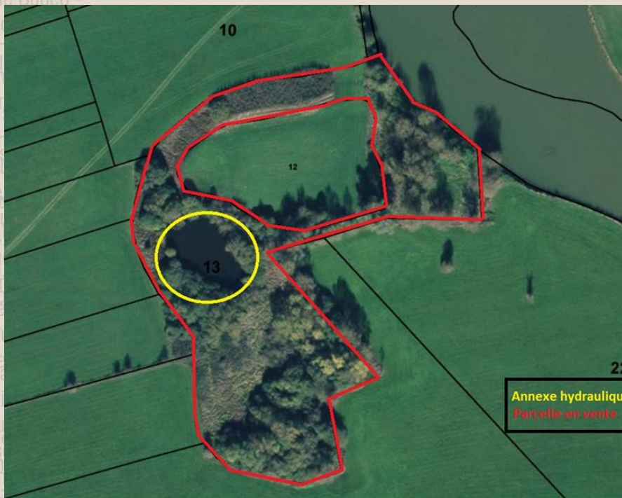
1,5 ha de zone humide à Stenay