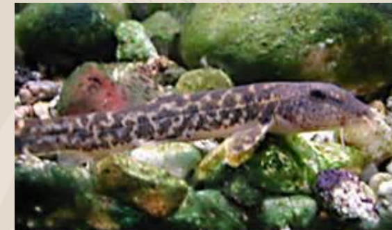
Présence de la Loche d'étang

Connaitre... Protéger... Gérer... Valoriser