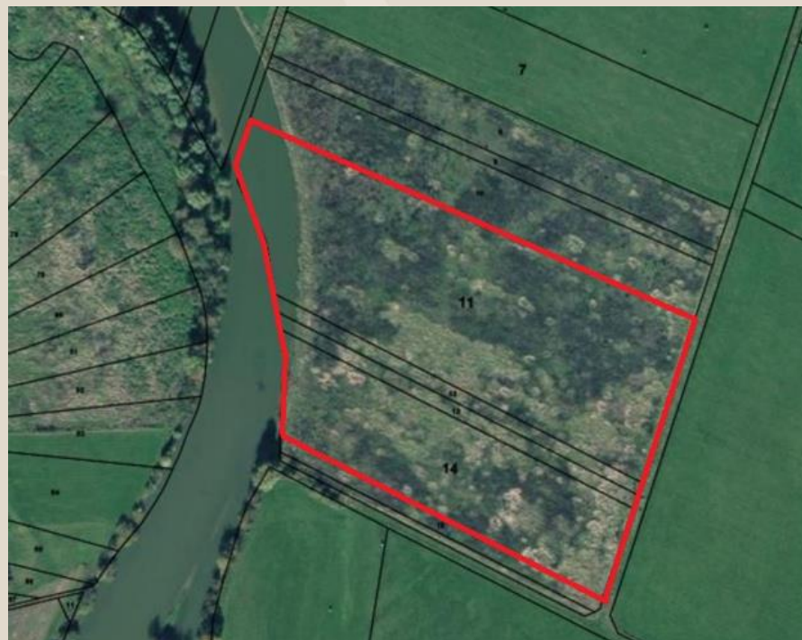
4,67 ha de friche à Mouzay, avec un projet de retour en prairie.