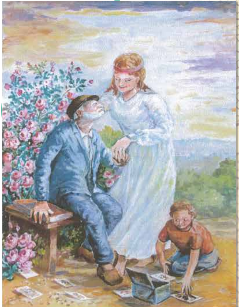
Jllustration Riandel Ernest