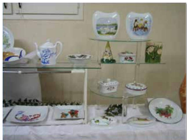
peinture sur porcelaine