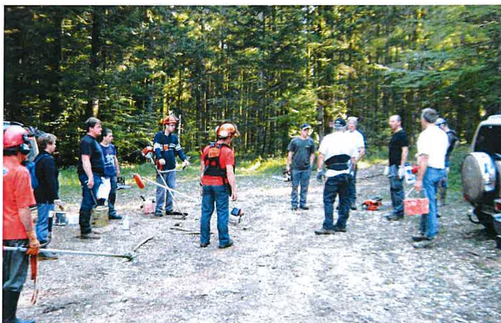
Ci-dessus les consignes avant le départ

Toutes les personnes qui veulent participer à cette journée sont les bienvenues, et peuvent le faire savoir au secrétariat.