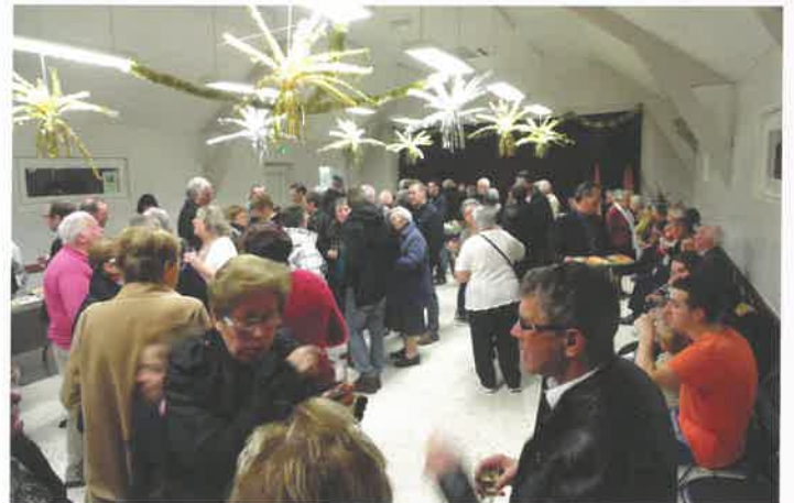
Les vœux 2018 : toujours très suivis