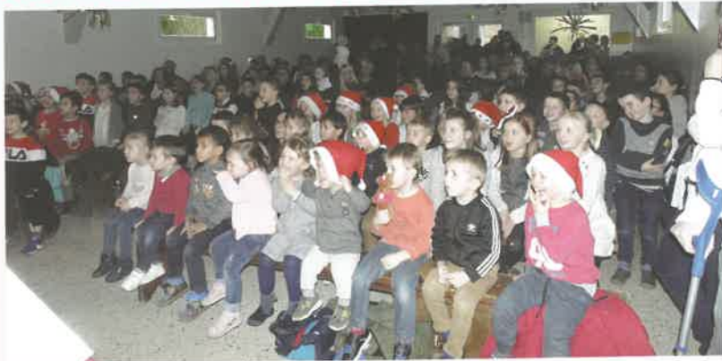
Le Noël des enfants : le Père Noël était attendu