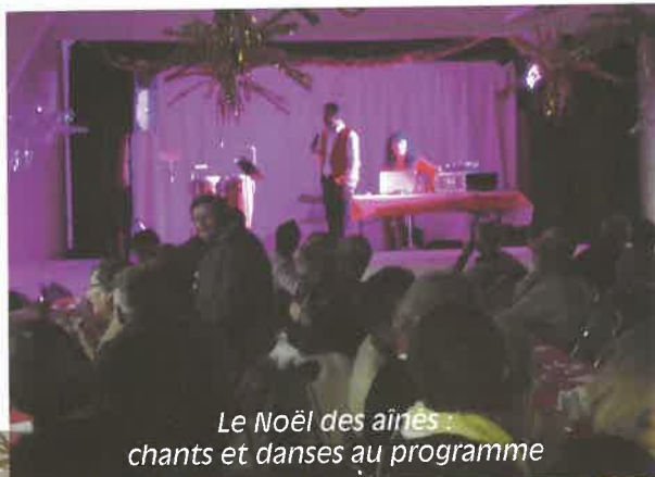
Le Noël des aînés : chants et danses au programme

La convivialité d'un village c'est aussi la joie et le bonheur de se retrouver pour des sorties divertissantes et festoyantes : le traditionnel Salon de l'agriculture attirant toujours autant les amoureux du terroir et de la bonne chair, puis le dîner-spectacle organisé tous les trois ans pour fêter le bien vivre ensemble, la randonnée pédestre, la fête du Hareng au profit du téléthon (80 convives et 400 € de bénéfice), enfin petits et grands attendant toujours avec impatience le moment magique de Noël.