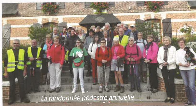
La randonnée pédestre annuelle