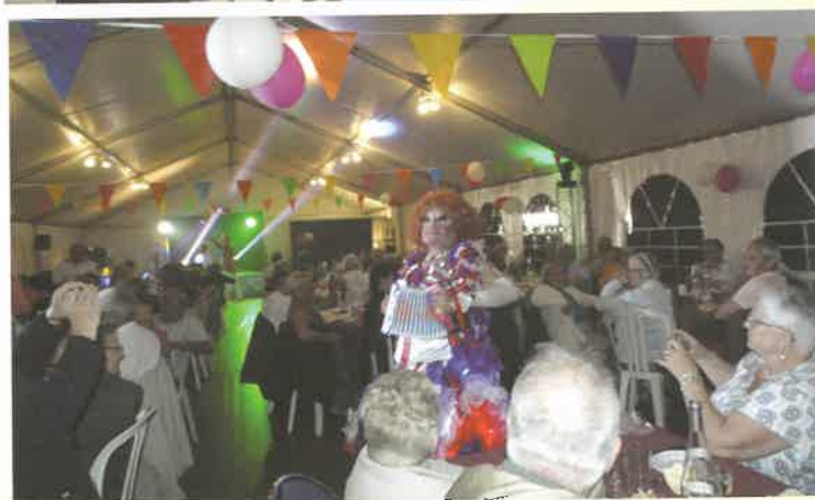
La fête du village