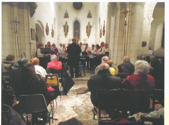
Concert de Noël