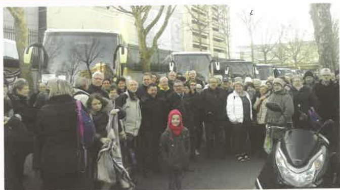
Sortie au salon de l'agriculture