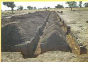
Les fondations du futur collège de Konankoïra ont été creusées par les parents d'élèves en novembre 2018

L'association Cap développement œuvre depuis plus de 24 ans dans la coopération internationale pour un monde plus paisible et plus harmonieux. Les actions menées visent à aider les populations de la région de Nouna, ville du nord-ouest du Burkina Faso à améliorer leurs conditions de vie : construction d'écoles primaires, de dispensaires, soutien aux activités socio-économiques (moulins pour les femmes, maraîchage, banques de céréales...). L'association s'appuie sur une base humaine et matérielle locale : au sein de la maison des associations, les personnels prospectent, étudient les projets, rédigent les demandes et ici en Normandie, cap développement apporte un soutien technique et cherche des partenaires financiers.