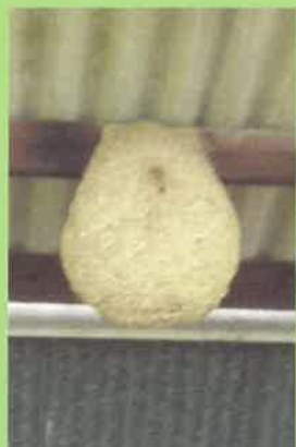
Exemple de nid

Depuis leur apparition sur notre territoire en 2004, les frelons asiatiques ont causé la destruction de nombreuses ruches d'abeilles, et sont une source potentielle de danger pour les personnes habitant à proximité des nids.