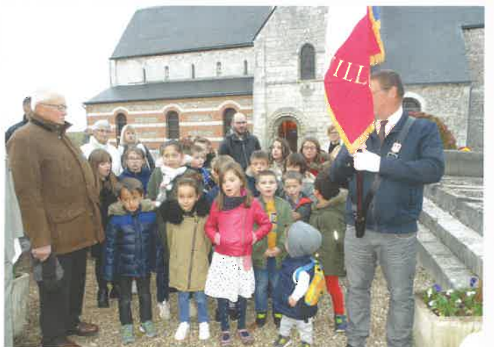
Hommage aux combattants : il fut particulièrement suivi pour commémorer le centenaire de la guerre 1914-1918