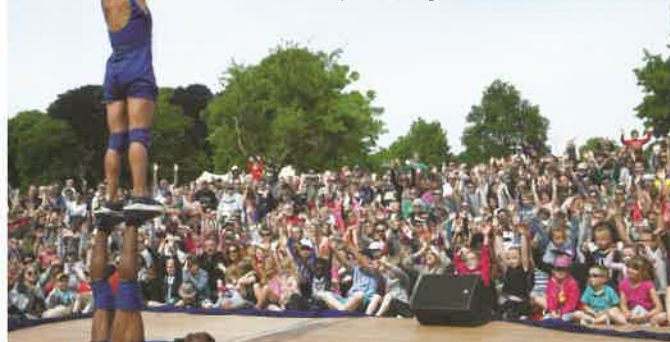
Fête du cirque 2, 3 et 4 juin