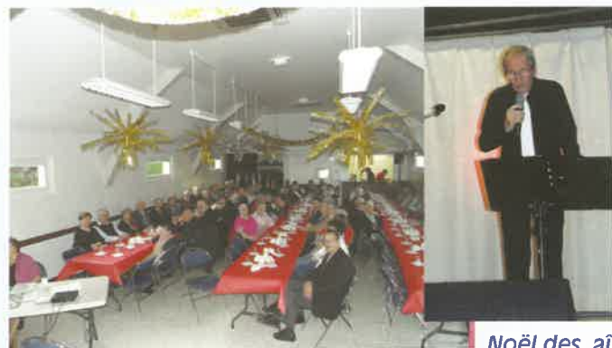
Noël des aînés