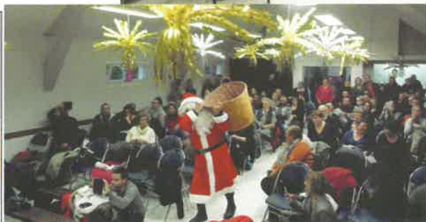
Noël des enfants. Un magicien a précédé le Père Noël