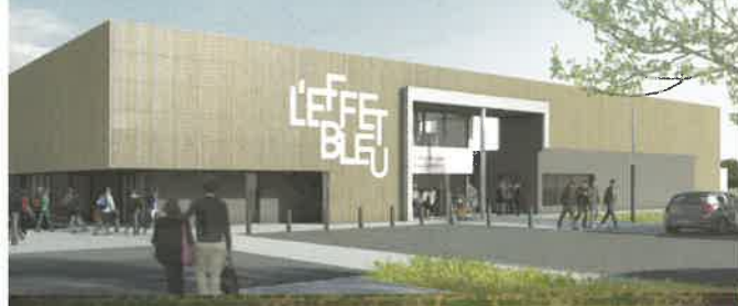
Pose de la première pierre du Centre Aquatique l'Effet Bleu 30 novembre