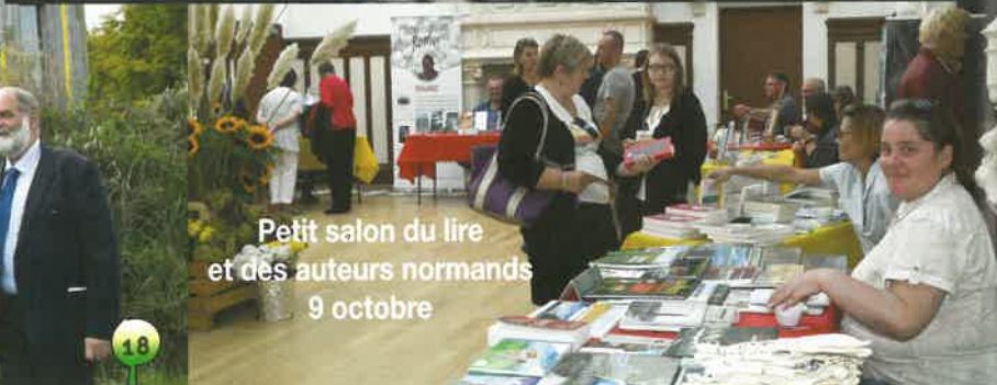
Petit salon du livre et des auteurs normands 9 octobre