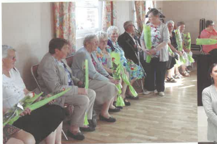
La Fête des Mères : une tradition respectée où ma- mans et grands mamans sont honorées. Elles le mé- ritent bien !