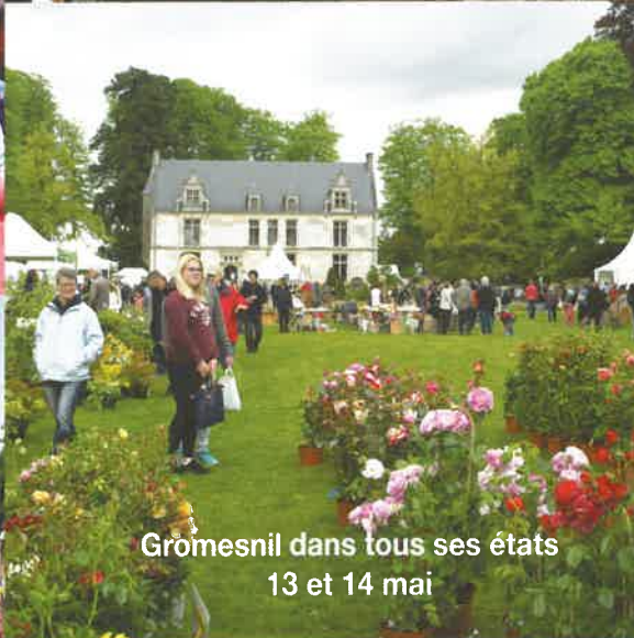
Gromesnil dans tous ses états 13 et 14 mai