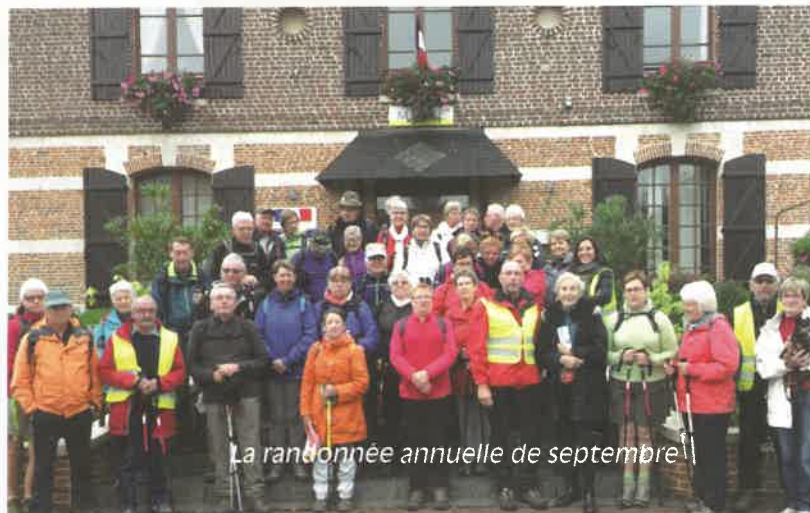
La randonnée annuelle de septembre