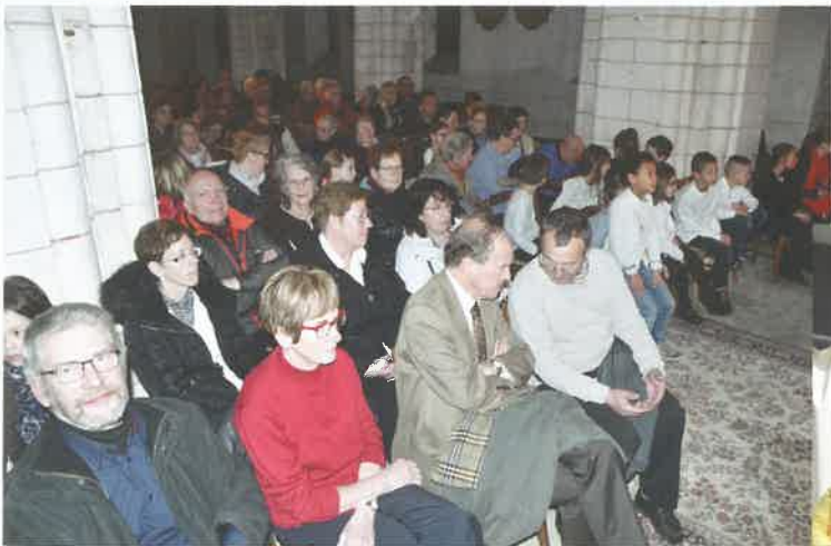
Le concert de Noël avec Scène en Musique, plusieurs chorales dont une intergénérationnelle.

Deux concerts dans l'église cette année avec celui de Printemps marquant la fin de la 1ère tranche de travaux et celui de Noël. Les amateurs de théâtre et d'humour ont pu se divertir, lors de la soirée sketches à la salle des fêtes proposé par Grain de Scène.