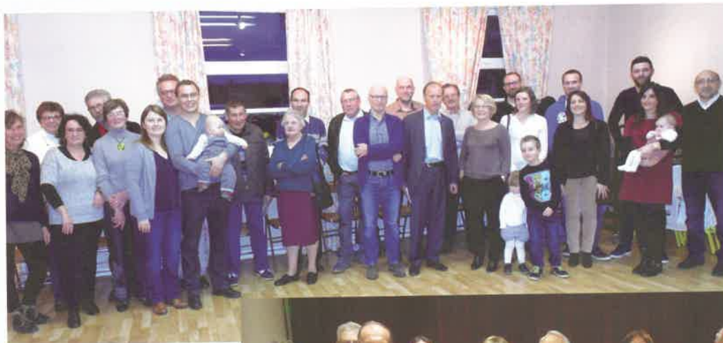
Les nouveaux habitants accueillis régulièrement par la municipalité

Honorer, féliciter, récompenser, celles et ceux qui le méritent : les Mamans et Grands Mamans, les travailleurs, les « mains vertes » et les nouveaux habitants de notre commune. Un petit cadeau, une petite attention pour chacune et chacun, c'est la reconnaissance adressée par le Maire et son Conseil Municipal, autour d'un cocktail amical.