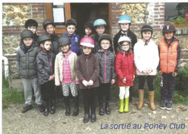
La sortie au Poney Club

Des promenades et escapades diverses sont proposées par la municipalité au cours de l'année. La découverte d'Amiens se terminant par un dîner-cabaret, la sortie poney des jeunes et la randonnée pédestre ont ravi petits et grands.