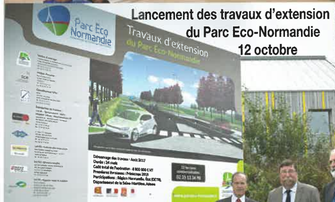
Lancement des travaux d'extension du Parc Eco-Normandie 12 octobre