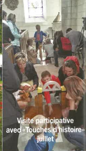
Visite participative avec « Touches d'histoire » juillet