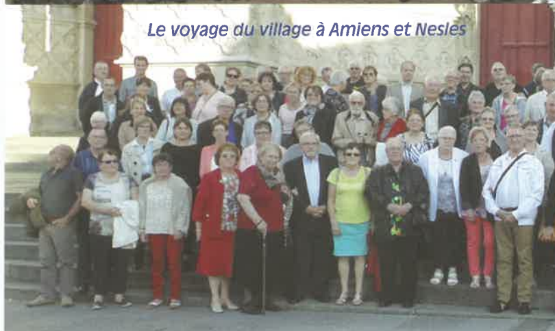
Le voyage du village à Amiens et Nesles

Des promenades et escapades diverses sont proposées par la municipalité au cours de l'année. La découverte d'Amiens se terminant par un dîner-cabaret, la sortie poney des jeunes et la randonnée pédestre ont ravi petits et grands.