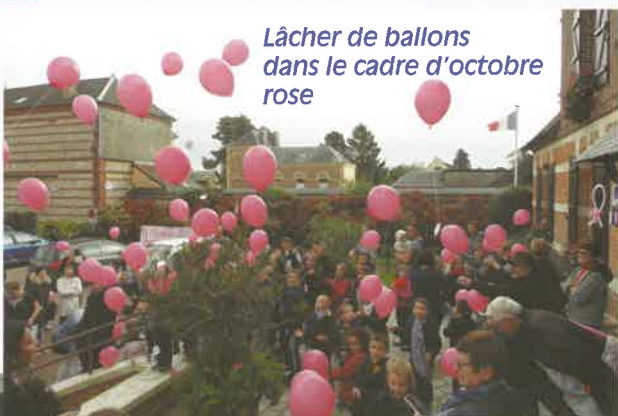
Lâcher de ballons dans le cadre d'octobre rose

Les Sainnevillais répondent toujours présents à l'occasion d'Octobre Rose et du Téléthon, deux manifestations solidaires bien ancrées maintenant. Soirée harengs, marche nocturne, lâcher de ballons. Et l'année se termine en spectacle pour nos aînés avec remise du colis de Noël proposé par la Municipalité et le Comité des Fêtes sans oublier le Noël des enfants et l'arrivée du Père Noël chargé de cadeaux.