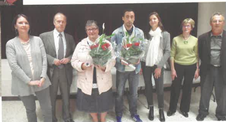
Des Médailles du travail mérités.