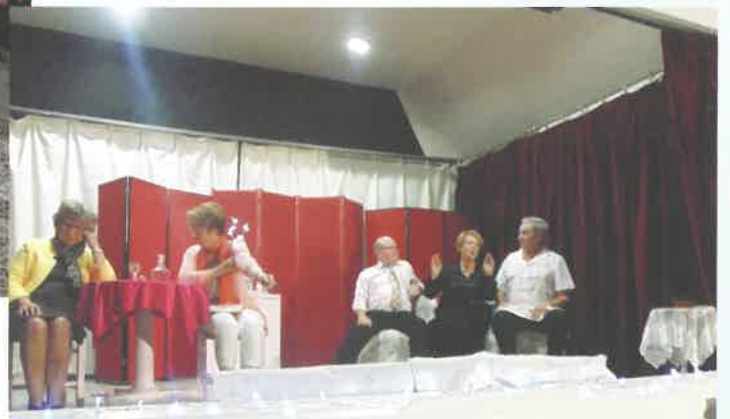
Grain de Scène revenu pour une soirée Sketchs.