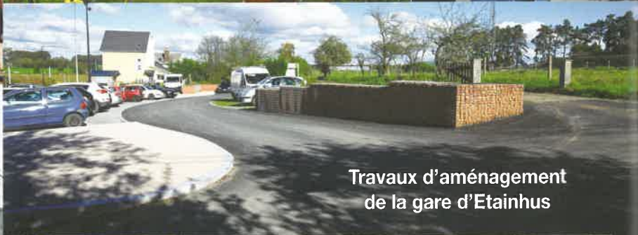
Travaux d'aménagement de la gare d'Etainhus