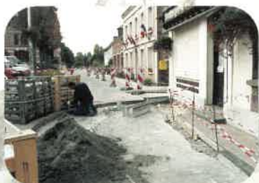
Pendant les travaux

Les travaux sont terminés, au printemps les bacs fleuris seront plus nombreux