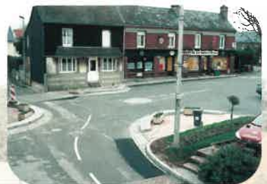
Sainneville infos - Décembre 2003

Les travaux sont terminés, au printemps les bacs fleuris seront plus nombreux