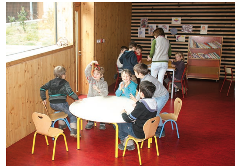
Garderie, bâtiment multifonctionnel