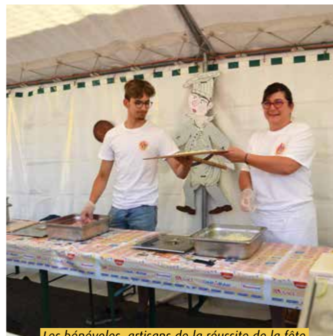
Les bénévoles, artisans de la réussite de la fête