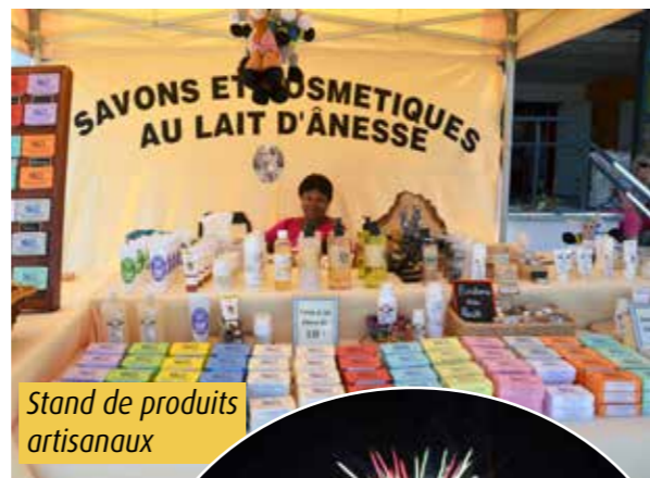
Stand de produits artisanaux