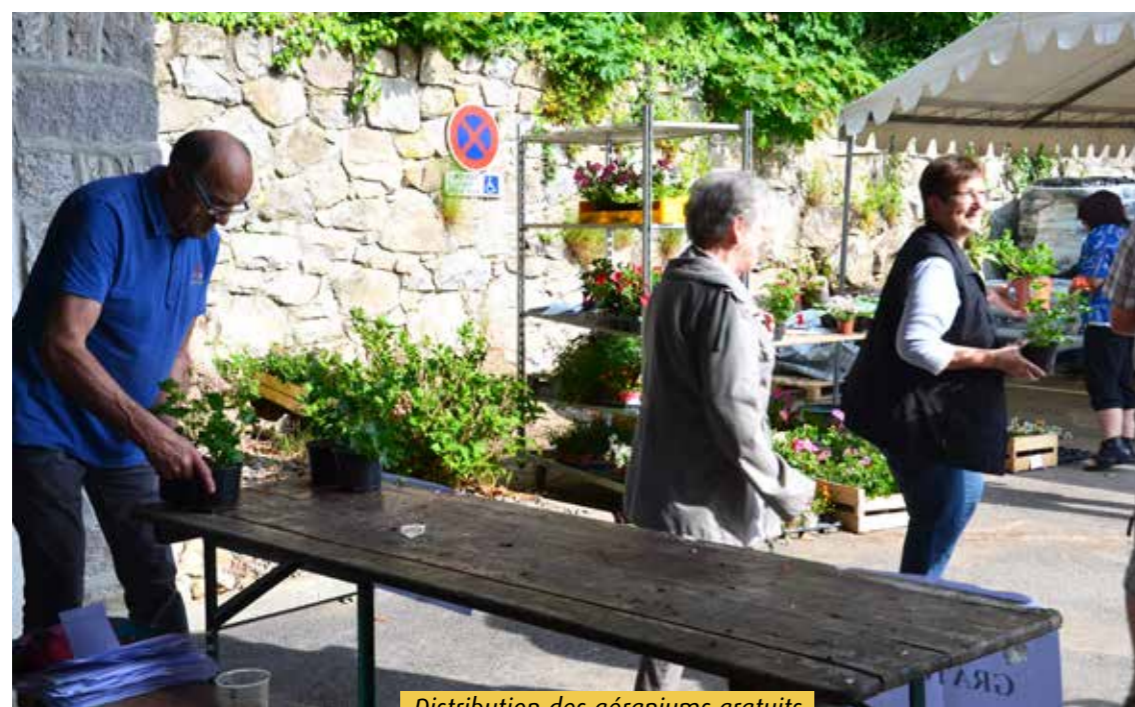
Distribution des géraniums gratuits