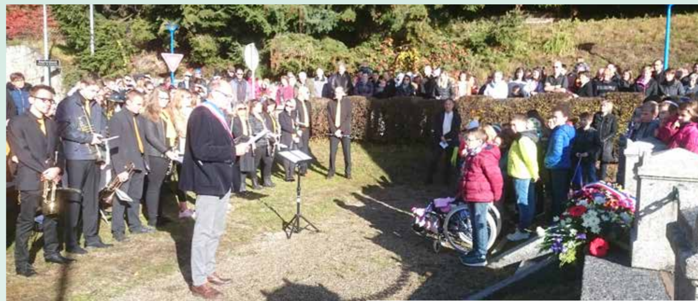
Le Maire lisant le message du Président de la République