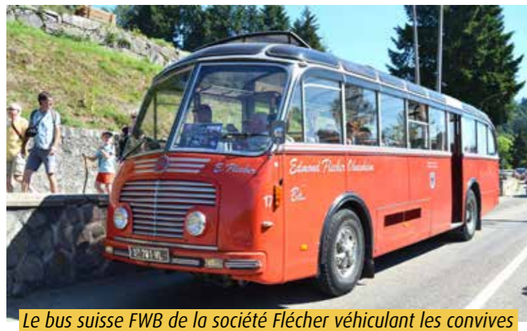
Le bus suisse FWB de la société Flécher véhiculant les convives