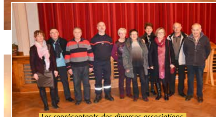
Les représentants des diverses associations