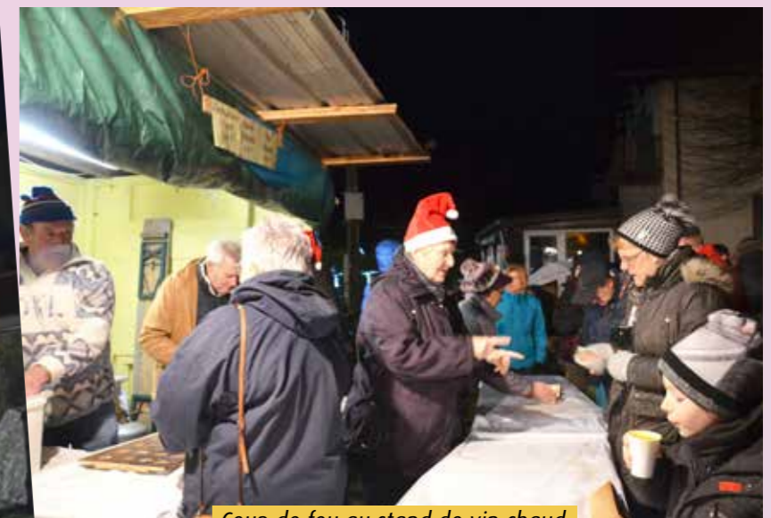
Coup de feu au stand de vin chaud à la chapelle du Schweinsbach