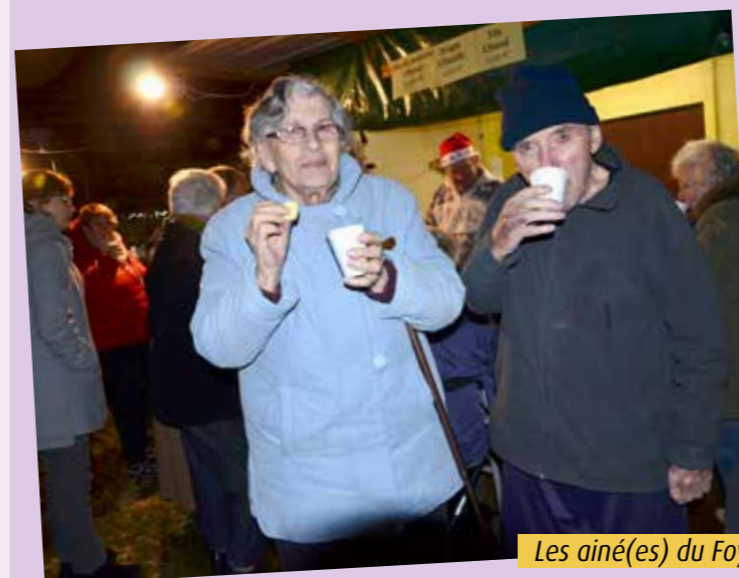
Les aîné(es) du Foyer du Parc