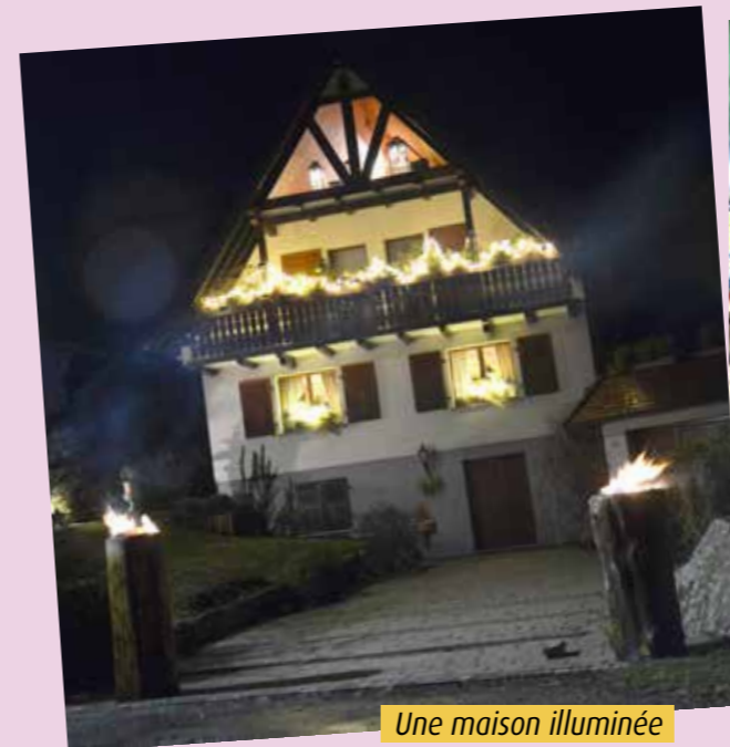
Une maison illuminée