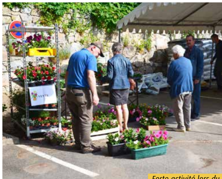
Forte activité lors du marché aux fleurs