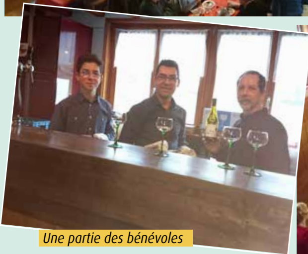
Une partie des bénévoles