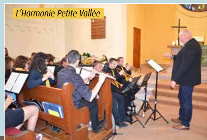
L'Harmonie Petite Vallée