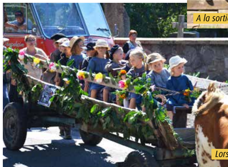
Lors du défilé