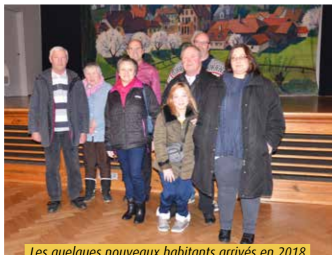
Les quelques nouveaux habitants arrivés en 2018