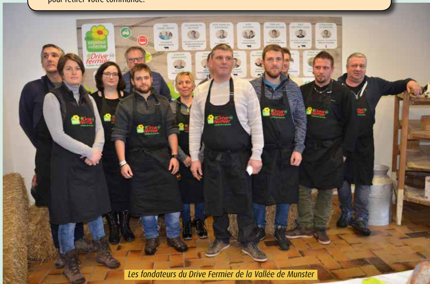
Les fondateurs du Drive Fermier de la Vallée de Munster