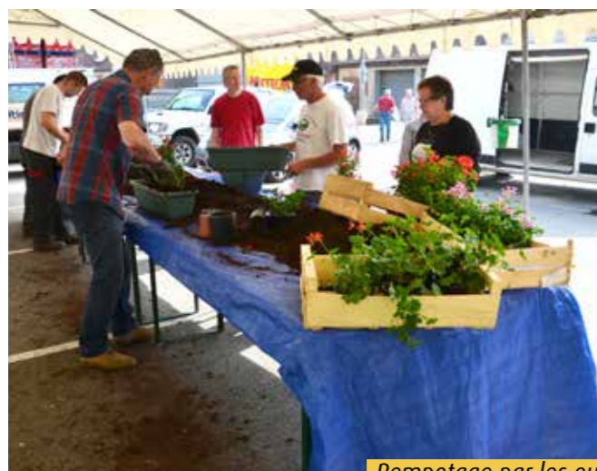
Rempotage par les ouvriers municipaux et les élus