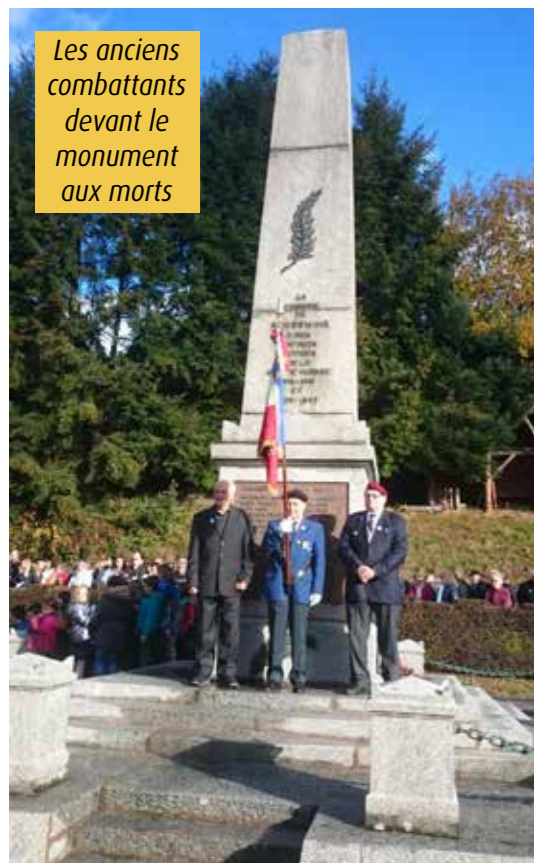
Les anciens combattants devant le monument aux morts