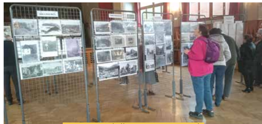
Des visiteurs de l'exposition très attentifs