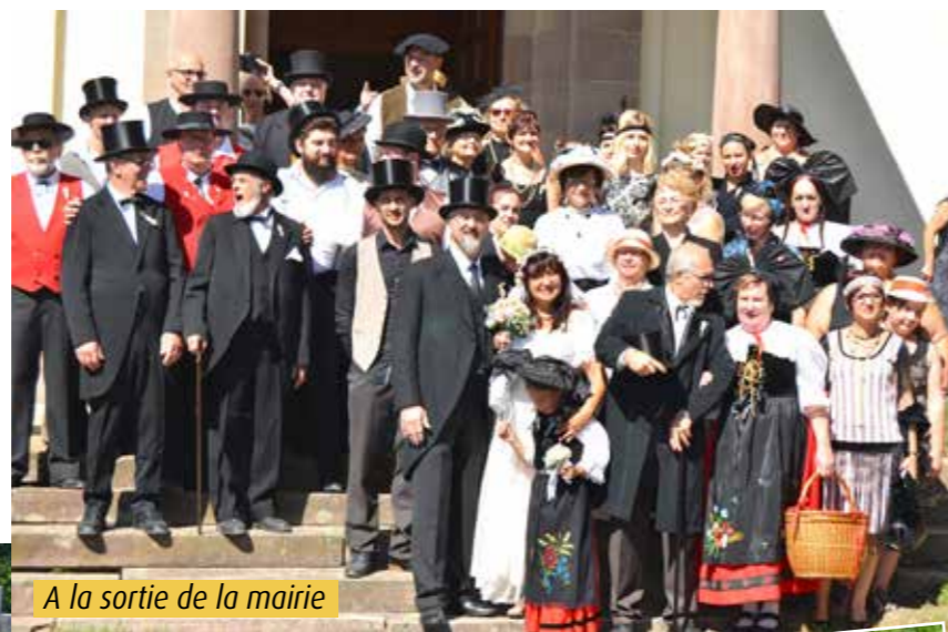
A la sortie de la mairie