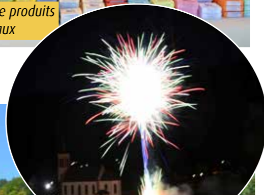
Un magnifique feu d'artifice a clôturé cette belle journée