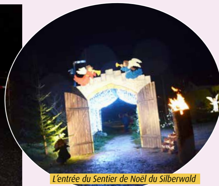
L'entrée du Sentier de Noël du Silberwald