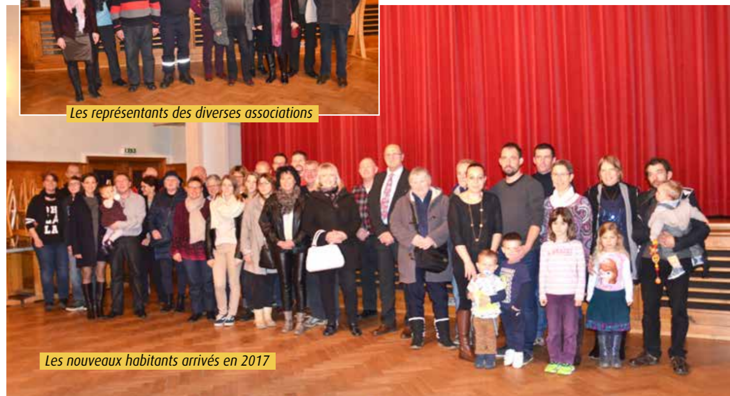
Les nouveaux habitants arrivés en 2017