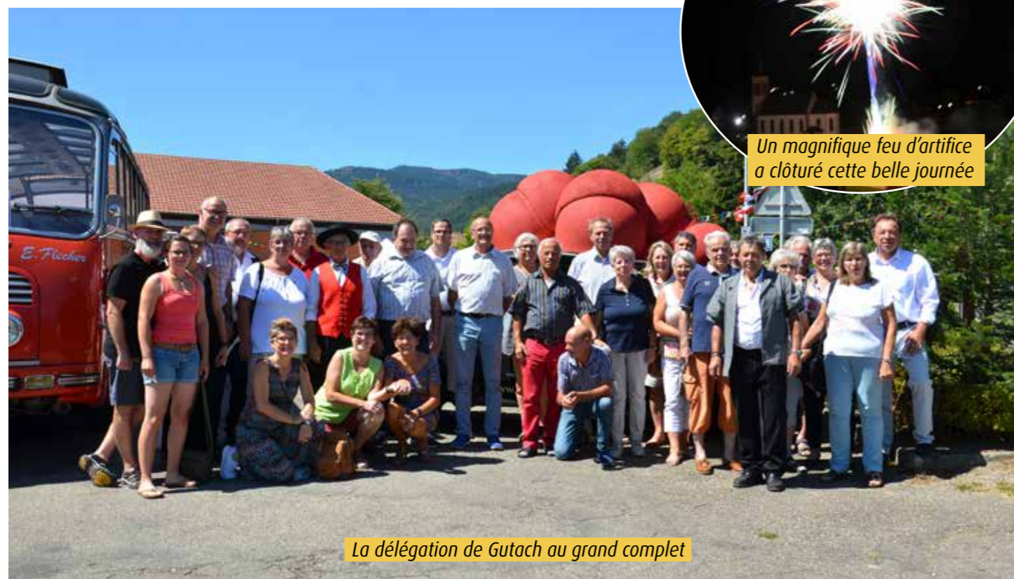
La délégation de Gutach au grand complet