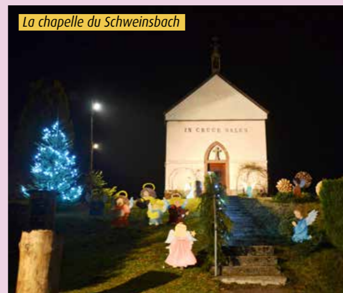
La chapelle du Schweinsbach