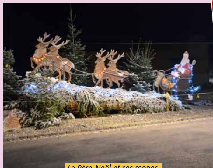
Le Père-Noël et ses rennes