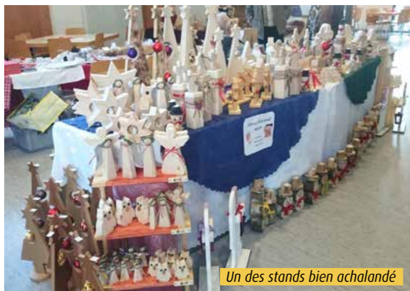
Un des stands bien achalandé

En effet, des liens amicaux se sont tissés au fil des années entre les deux associations, confortant ainsi le partenariat entre les deux communes.