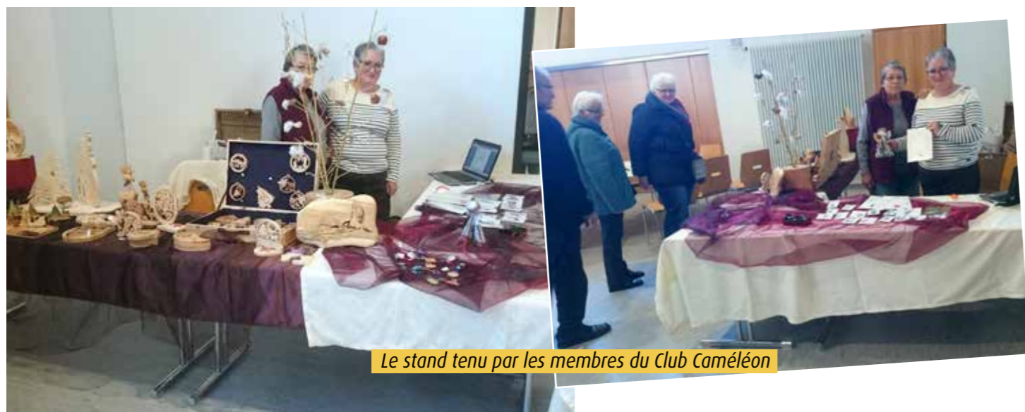
Le stand tenu par les membres du Club Caméléon