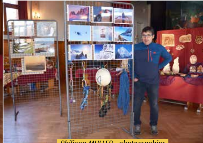
Philippe MULLER : photographies