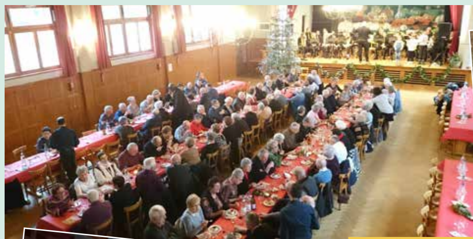
Une Salle des Fêtes bien remplie

L'Harmonie de la Petite Vallée avec le concours des élèves de l'école de musique puis les « Frankahtäler » ont assuré la partie récréative. Quant aux bénévoles de l'association familiale, ils se sont parfaitement acquittés du service en salle. Pour sûr, les aînés n'auront pas vu le temps passer. L'heure de se dire au revoir arrivant toujours trop vite.