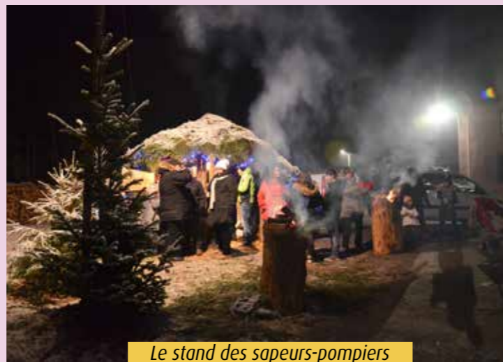
Le stand des sapeurs-pompiers qui proposaient leur tisane miracle