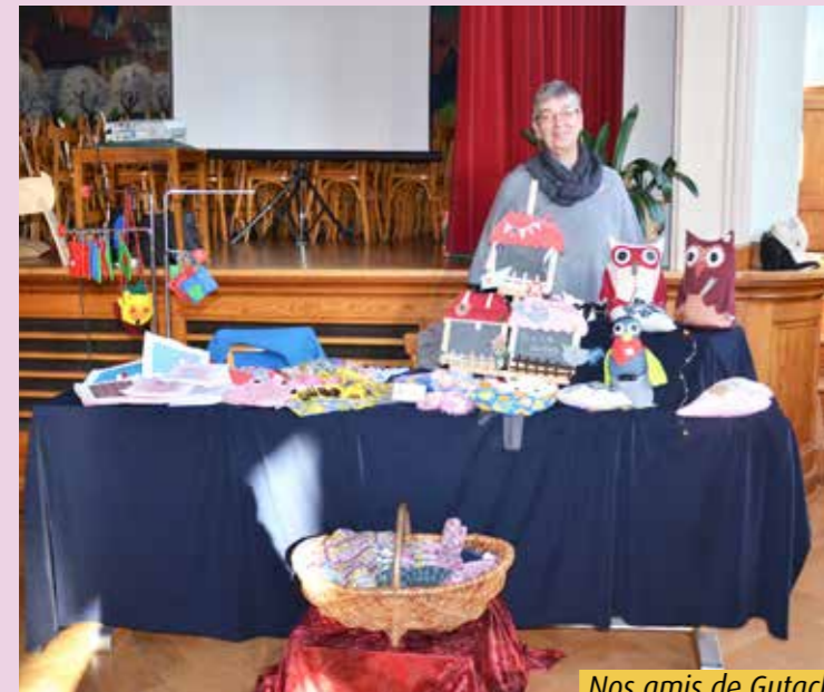
Nos amis de Gutach du Hobbykünstlerverein