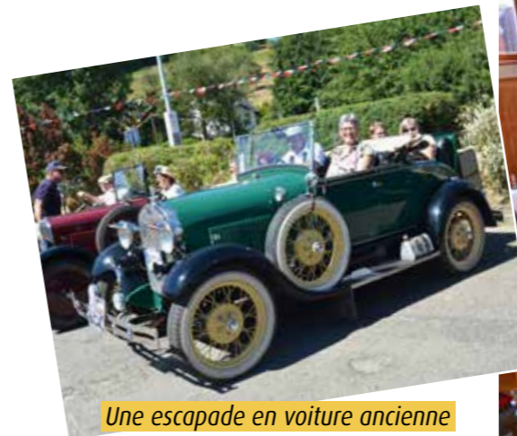
Une escapade en voiture ancienne