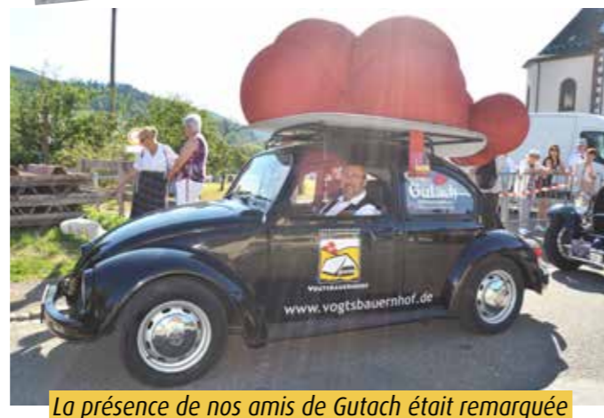
La présence de nos amis de Gutach était remarquable