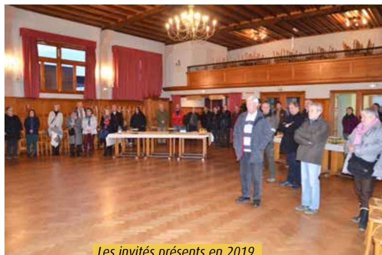
Les invités présents en 2019