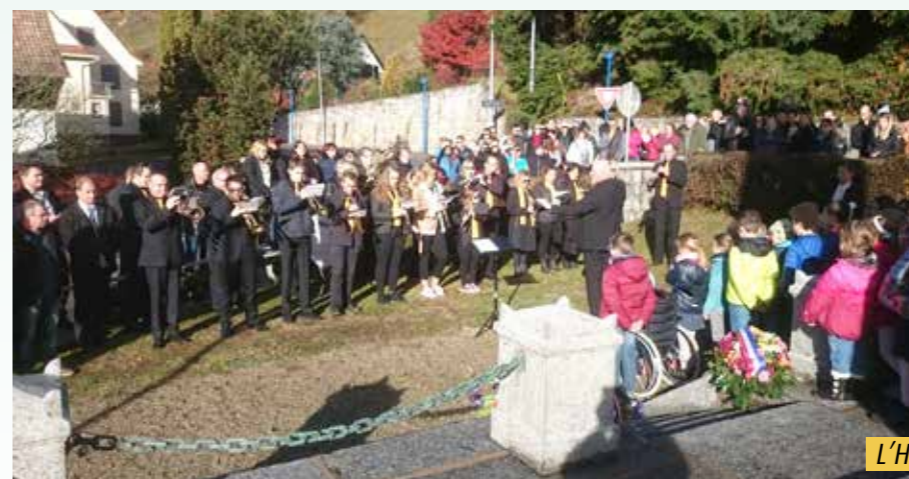
L'Harmonie Petite Vallée et les écoliers

Dans cette même Salle des Fêtes, une exposition de photos sur les villages de la Petite Vallée durant la 1 ère Guerre Mondiale attendait les curieux venus durant toute l'après-midi et qui n'ont pas hésité à poser des questions aux quatre exposants.