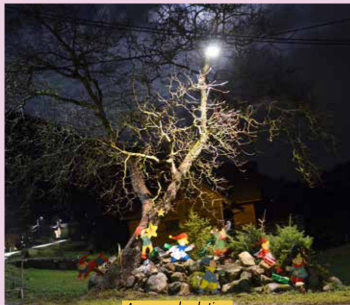
Au pays des lutins