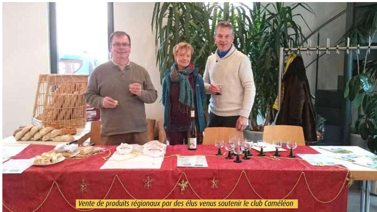
Vente de produits régionaux par des élus venus soutenir le club Caméléon