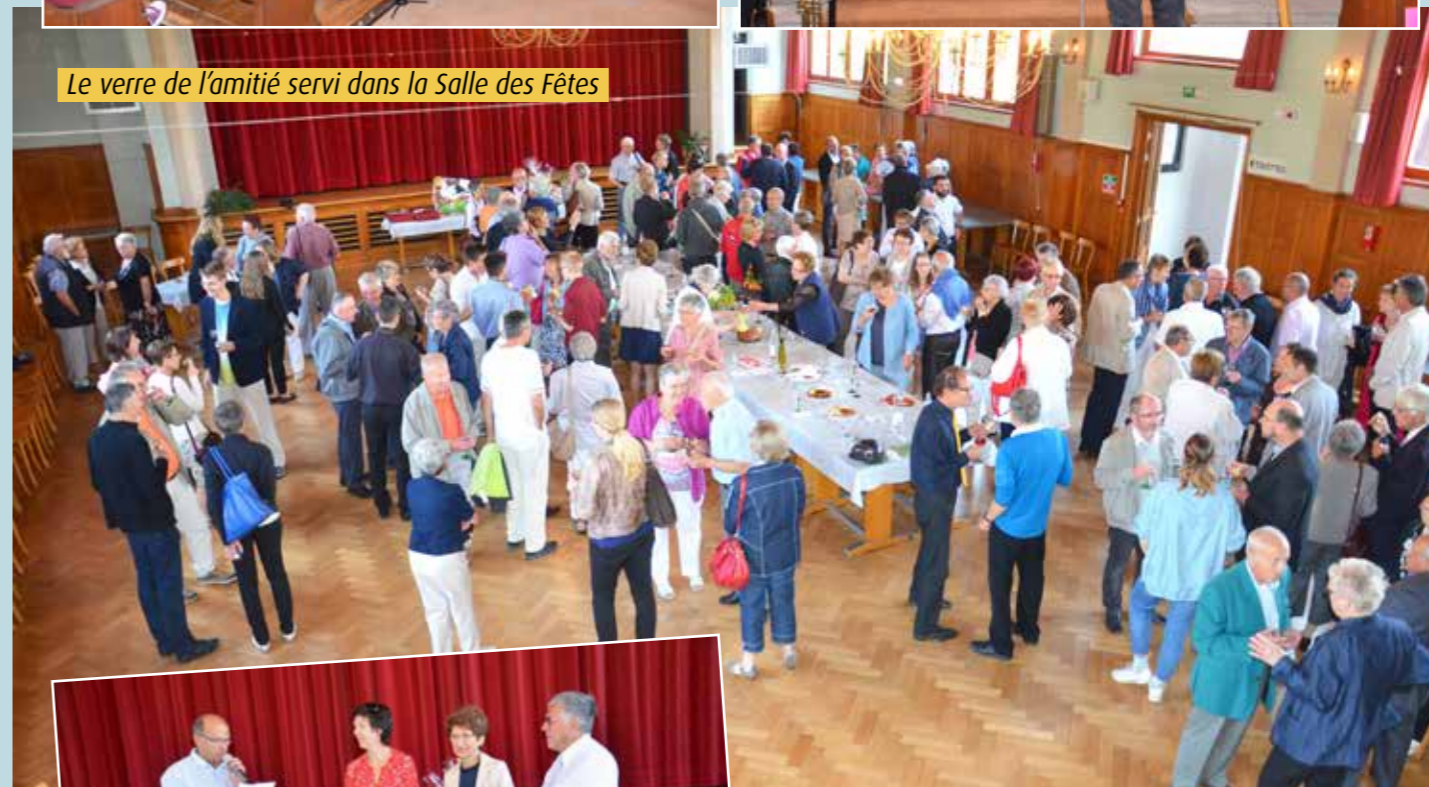
Le verre de l'amitié servi dans la Salle des Fêtes