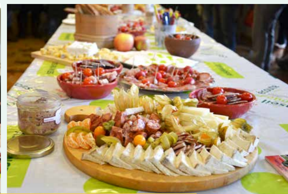
Le buffet, bien achalandé avec des produits locaux de qualité