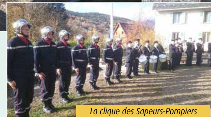
La clique des Sapeurs-Pompiers et le corps local des Sapeurs-Pompiers

Le 11 novembre 2018, Stosswihr comme toute la France a célébré le centenaire de l'Armistice de la Grande Guerre 1914-1918. Les habitants du village sont venus plus qu'à l'accoutumée pour assister à la cérémonie et rendre hommage aux « Morts pour la France ».