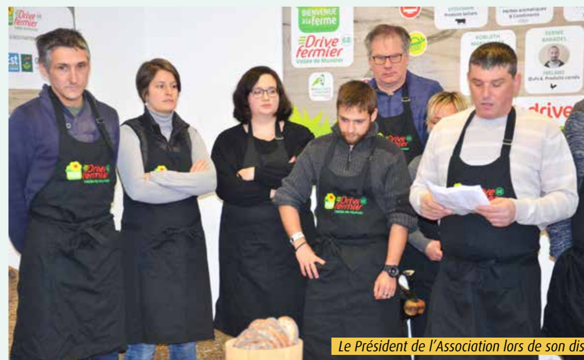
Le Président de l'Association lors de son discours