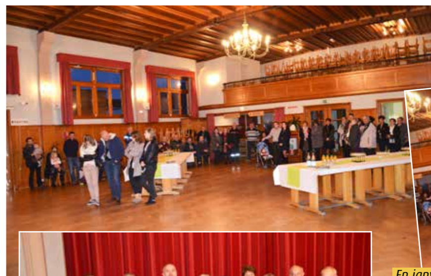
En janvier 2018, les invités étaient nombreux