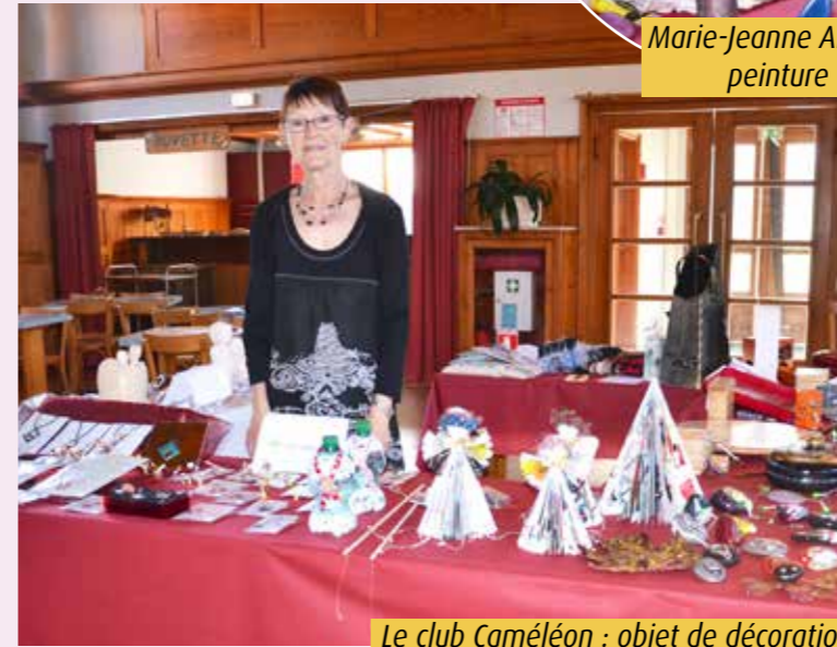
Le club Caméléon : objet de décorations, bijoux artisanaux et sculptures