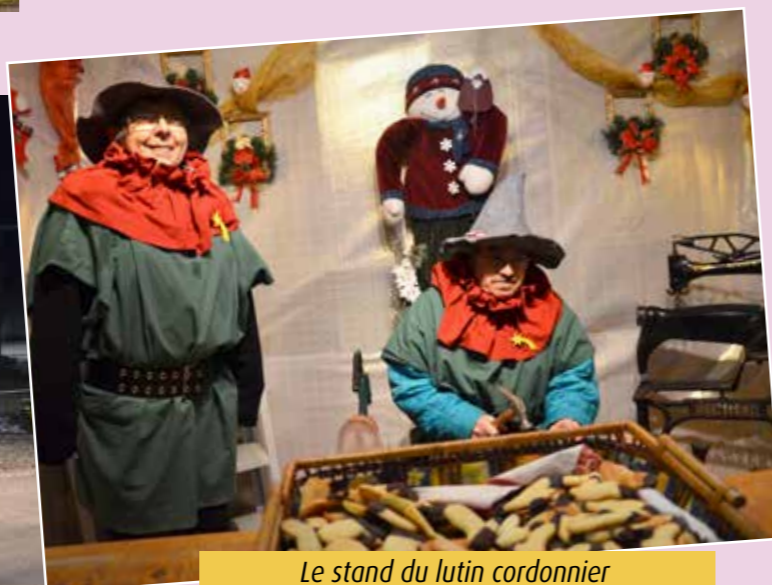
Le stand du lutin cordonnier avec sa lutine offrant ses fameux « bredalas »