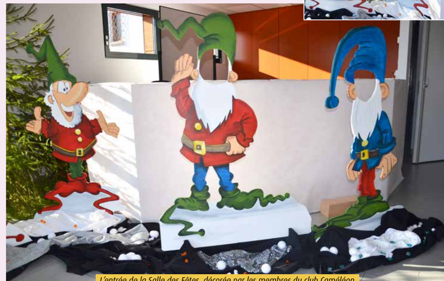
L'entrée de la Salle des Fêtes, décorée par les membres du club Caméléon