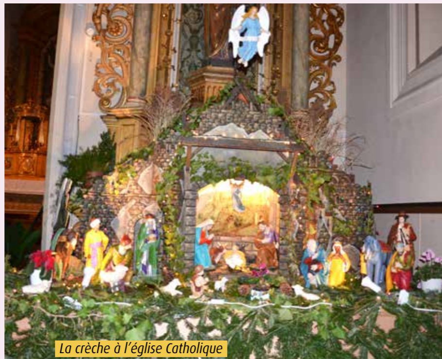
La crèche à l'église Catholique

Après un verre de vin chaud, la balade s'est poursuivie vers un Noël plus festif qui fait la part belle aux contes et légendes populaires avec ces gnomes et autres farfadets. La ferme Schubnel avait ouvert ses portes et les visiteurs pouvaient approcher les vaches vosgiennes ainsi que les petits veaux.