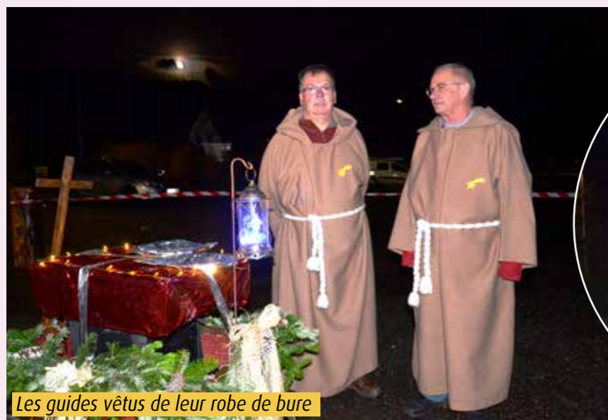
Les guides vêtus de leur robe de bure