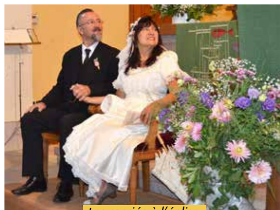
Les mariés à l'église

Durant toute l'après-midi se sont déroulées les diverses animations, dont le tirage de la tombola richement dotée. Le soir, le traditionnel feu d'artifice attendu par tous a clôturé cette magnifique fête.