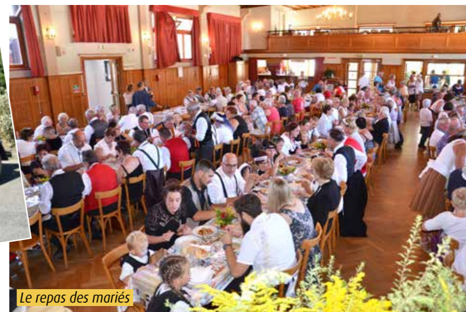
Le repas des mariés