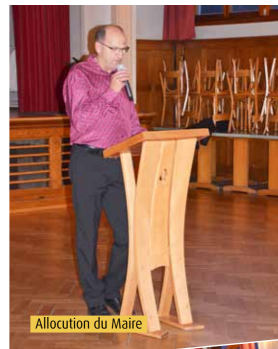
Allocution du Maire

Il a aussi tenu à rappeler les actions menées en 2017 et 2018 par la municipalité, et en faisant un point sur les travaux en cours et envisagés en 2019. C'est autour du verre de l'amitié et en partageant la galette des rois, que les personnes présentes ont échangé et fait plus ample connaissance.