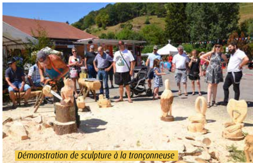
Démonstration de sculpture à la tronçonneuse