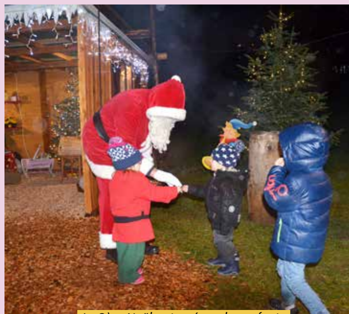
Le Père Noël entouré par les enfants