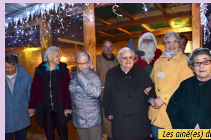
Les aîné(es) du foyer « Caroline »

Nos anciens n'ont pas été oubliés. En effet, des membres du Comité des Fêtes et des bénévoles se sont mobilisés pour accueillir lors de deux soirées, les résidents des maisons de retraite « Foyer Caroline » et « Foyer du Parc ». Après un tour en voiture dans le vallon d'Ampfersbach permettant à chacun d'admirer les diverses illuminations et décorations, une première halte a eu lieu à la maison du Père Noël, où ce dernier les attendait pour offrir des friandises avant d'entonner avec les aînés des chants de Noël. Ensuite, tous se sont retrouvés à la chapelle où un verre de vin chaud fut servi. Que d'émotions et de souvenirs partagés lors de ces soirées.