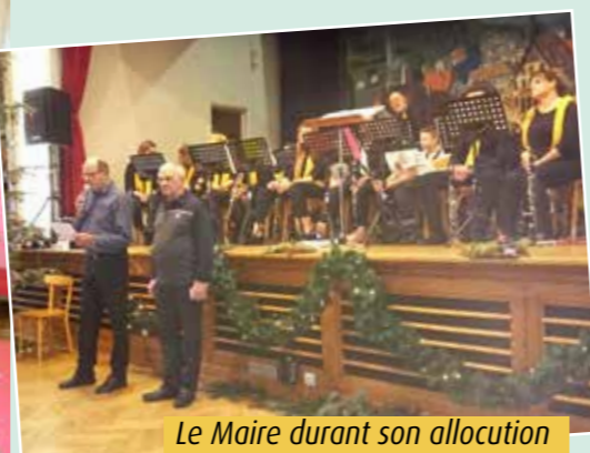
Le Maire durant son allocution