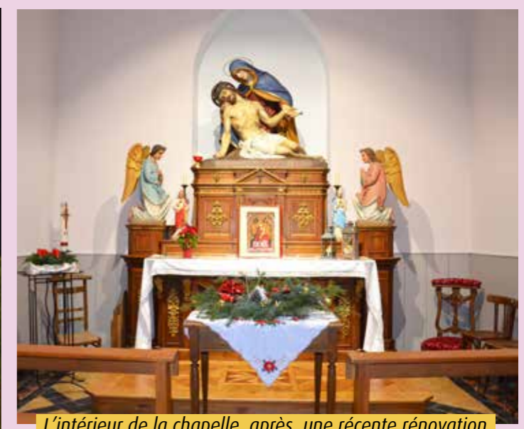
L'intérieur de la chapelle, après une récente rénovation