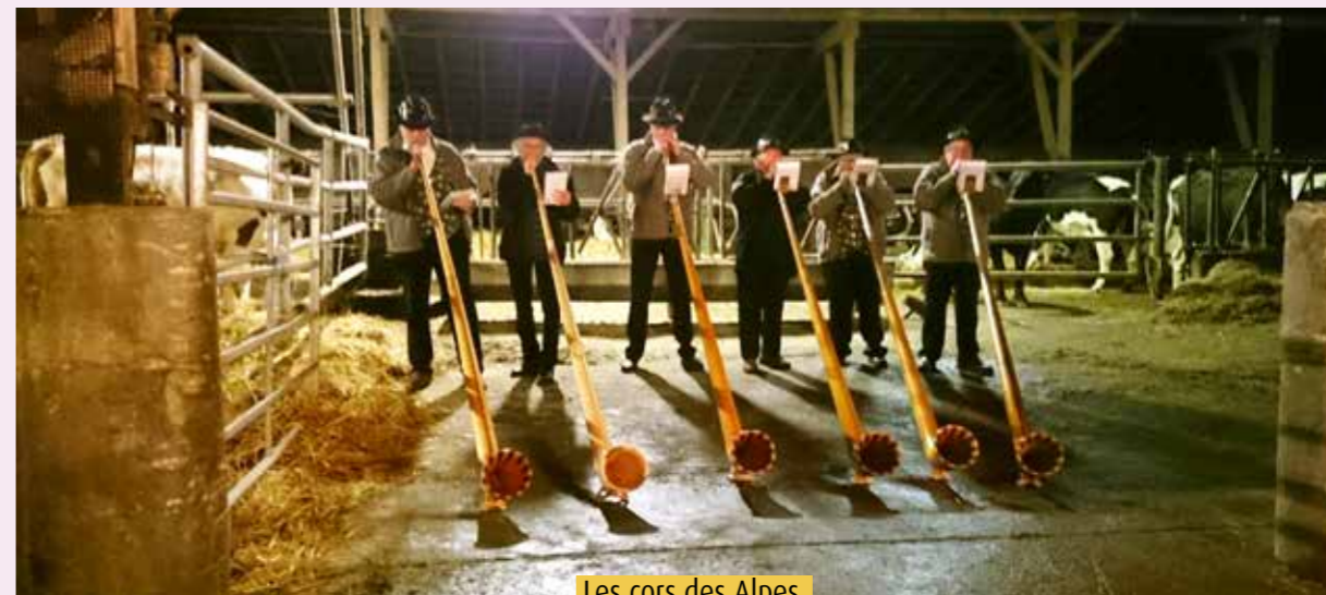
Les cors des Alpes