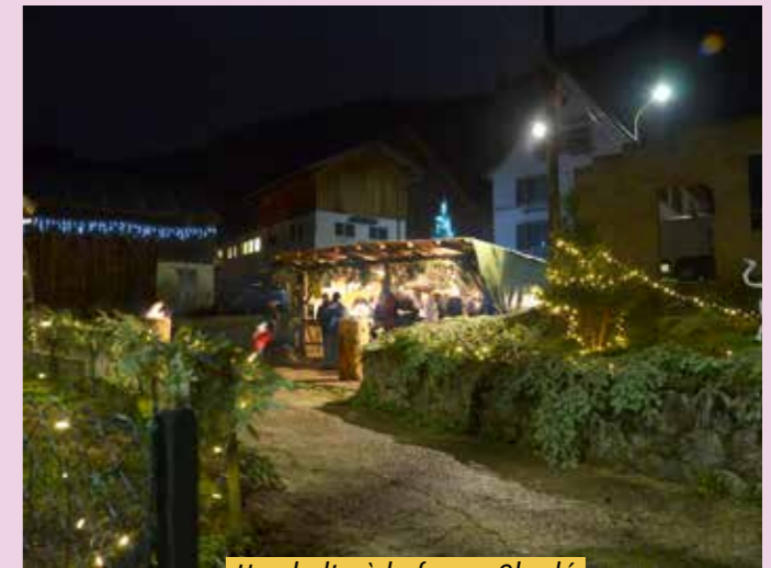
Une halte à la ferme Oberlé