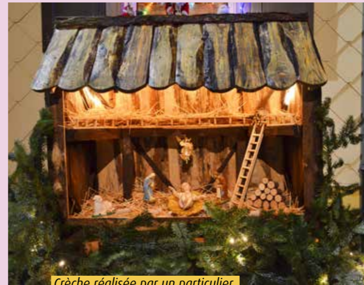
Crèche réalisée par un particulier