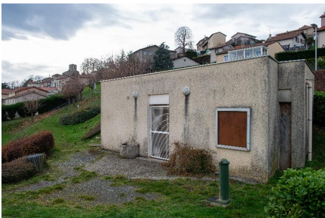
Le bâtiment actuel

Dans le cadre du plan de relance, une subvention est sollicitée à la région AuRA, une autre est promise par le département.