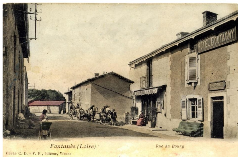
La rue de la Sibérie au début du XXème siècle

Nous vous tiendrons informés de l'avancement de ce projet.