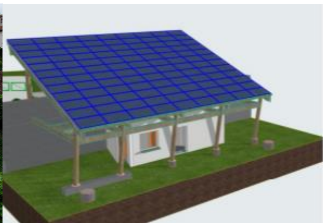
Une première esquisse du projet