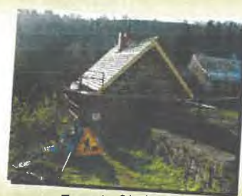
Four de Cholonge