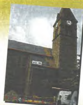
Toiture de l'église