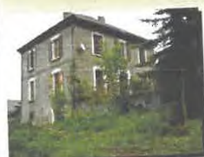
Création de deux logements dans l'ancien presbytère