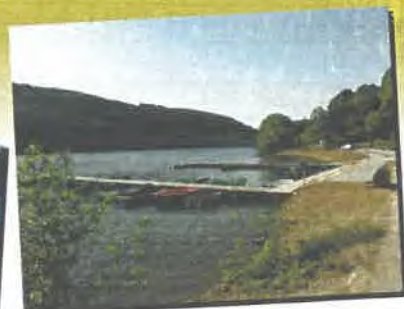
Aménagement du lac à la Bergogne