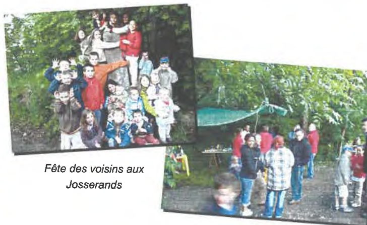
Fête des voisins aux Josserands