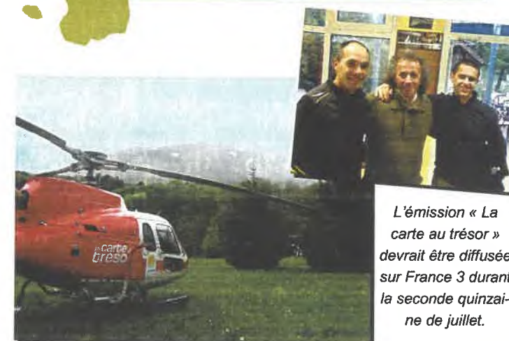
L'émission « La carte au trésor » devrait être diffusée sur France 3 durant la seconde quinzaine de juillet.