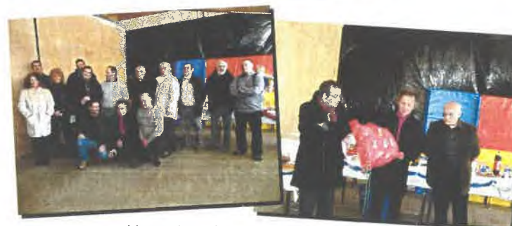
Vœux du maire et remise de médailles