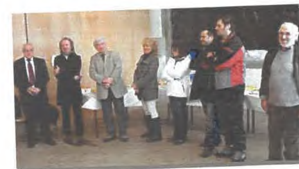
Vœux du maire 17/01/2010