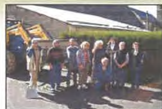
Journée citoyenne du 22 octobre