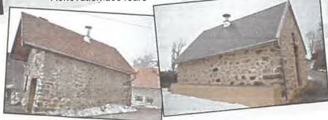
Rénovation des fours