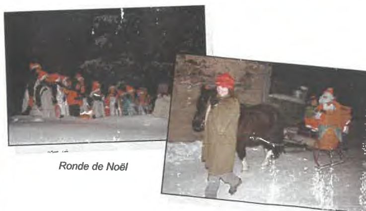
Ronde de Noël