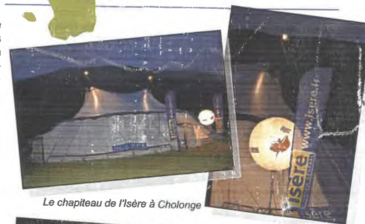
Le chapiteau de l'Isère à Cholonge