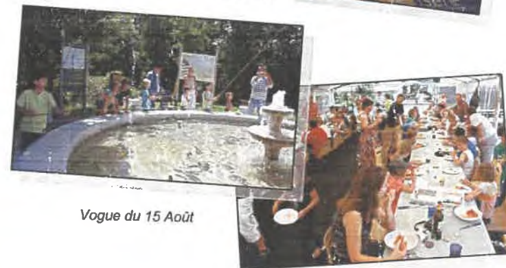
Vogue du 15 Août