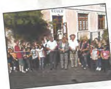
Inauguration de la cours de l'école