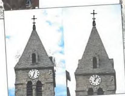
Avant / Après