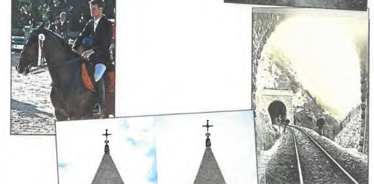
Les « fameux » Cinquante mètres