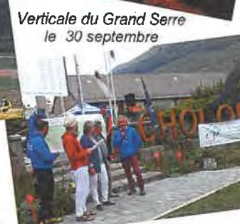
Verticale du Grand Serre le 30 septembre