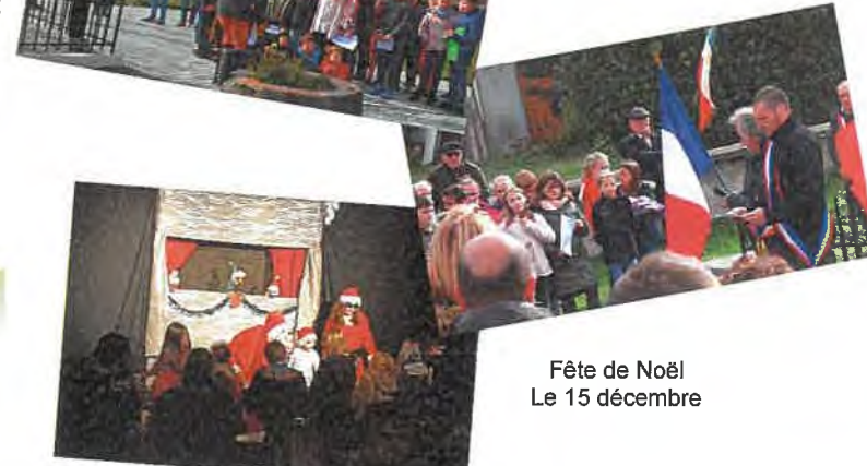
Fête de Noël Le 15 décembre