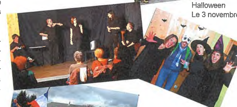
Halloween Le 3 novembre