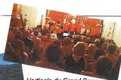
Chœur des Ecrins Le 12 août