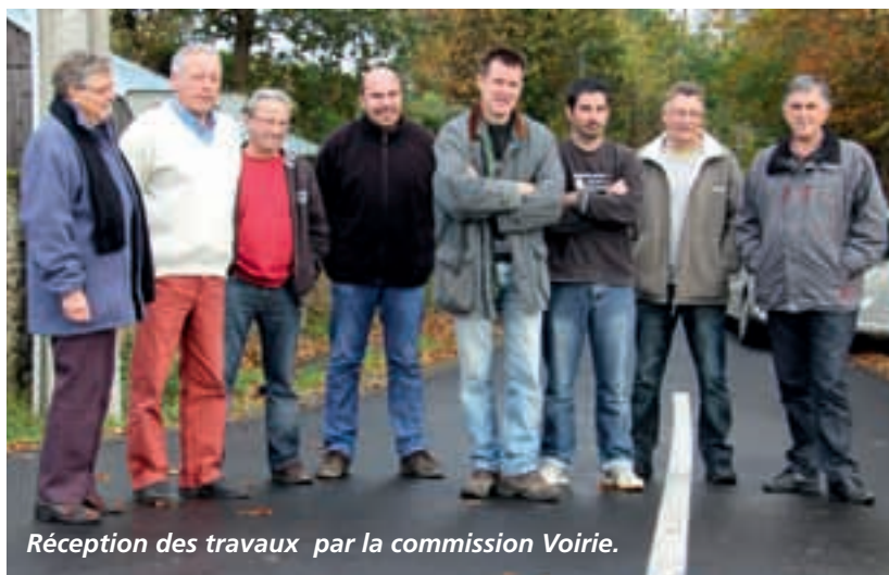
Réception des travaux par la commission Voirie.

plusieurs lieux dits de notre commune ne sont pas répertoriés par ce nouveau système de pilotage et de plus nous ne sommes pas tous dotés de ces nouvelles technologies et donc la vieille méthode des plans, garde toujours sa pertinence.