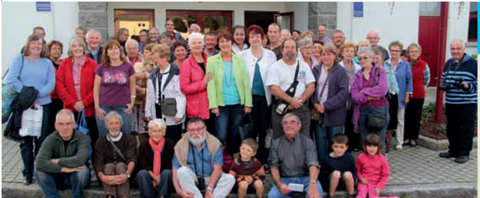
Journée d'arrivée des amis irlandais.