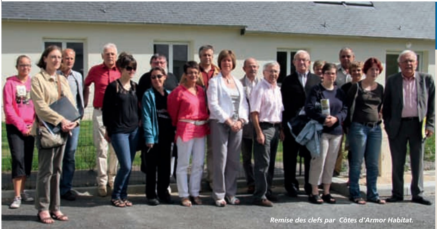
Remise des clefs par Côtes d'Armor Habitat.