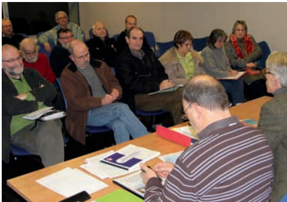
Assemblée générale de l'APSPLV.

Par ailleurs le dossier réalisé par Bureau Horizons, a été diffusé à l'ensemble des structures et institutions en charge de la problématique des déchets et mis en ligne sur le site Internet de l'association.