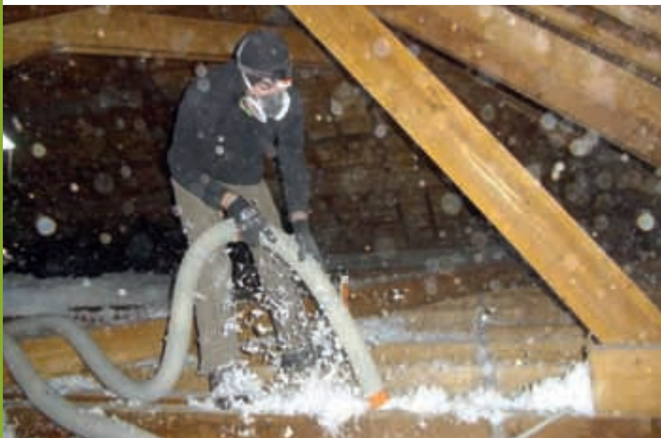
Insufflation de ouate de cellulose dans les combles par l'entreprise Quali confort.

L'ensemble de ces travaux, pour un montant global de 93 757 € HT se décline ainsi, outre les coûts liés aux études menées par Armor Ingénierie ( 3 870 € HT) et divers travaux (4 229 €), nous trouvons d'une part pour les huisseries de fenêtres réalisés par l'Entreprise RENOUARD (coût des travaux 78 507 € HT), d'autre part l'isolation des combles en élémentaire par l'entreprise Quali Confort (coût des travaux 9 389 € HT) et le changement des robinets thermostatiques à l'école maternelle (1 562 € HT), devrait améliorer tant le confort de ces bâtiments, que la facture de consommation des énergies. Ce projet présenté comme prioritaire par la municipalité de Pommerit Le Vicomte lors des négociations du contrat territorial conclu entre les 15 communes et la communauté de communes Lanvillon Plouha, avec le Conseil général a obtenu 32 665 € de subvention, dans ce cadre.