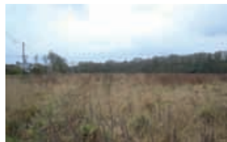
Terrain du lotissement de Mezmeur.

Bien vivre à Pommerit Le Vicomte ... C'est possible !