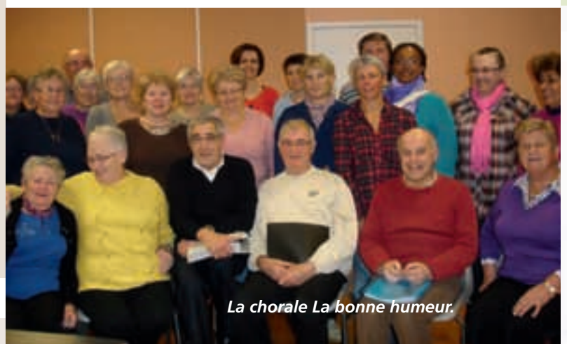
La chorale La bonne humeur.

Pour 2012 nous avons prévu un concert le 14 avril, un loto le 1 er juillet et le téléthon le 17 novembre 2012.