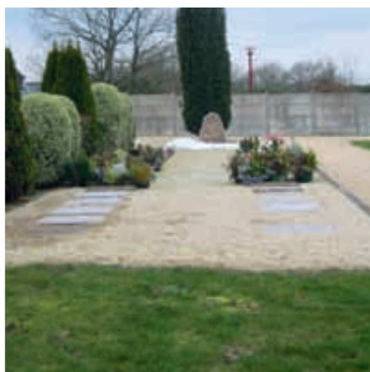
Vue du jardin des souvenirs.