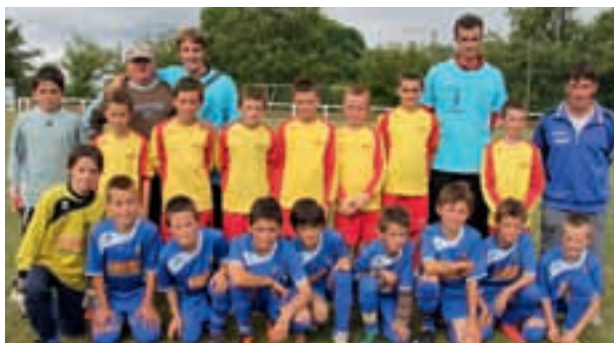
Les jeunes pousses de l'ESPLV.