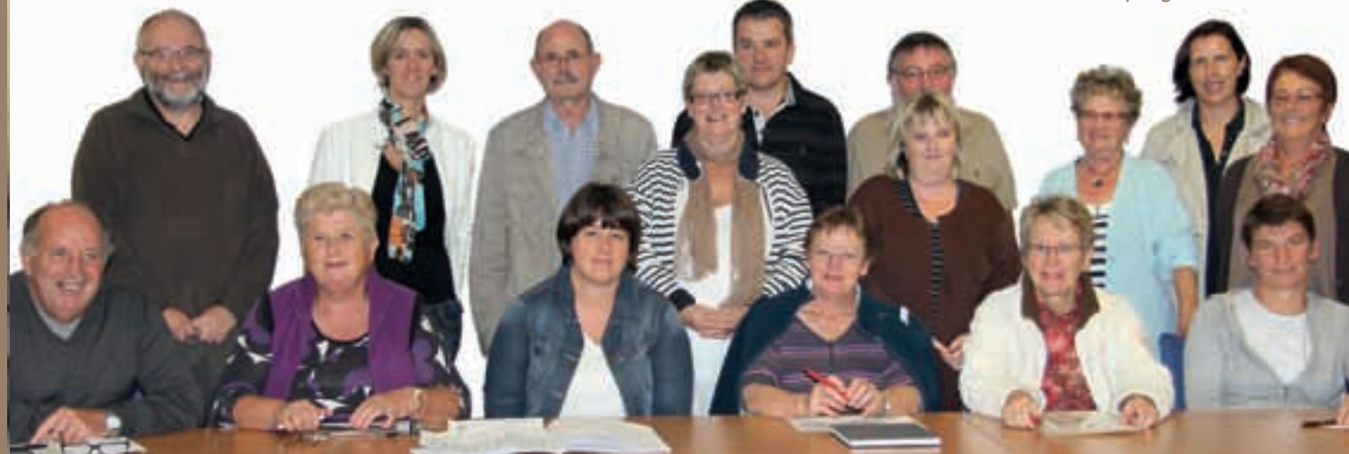
La réunion annuelle de programmation.