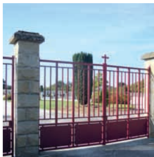
L'entrée du cimetière.