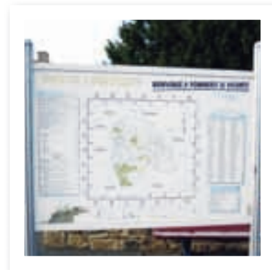
Un des panneaux en cours de réfection

En effet bien que maintenant il existe le GPS, il ressort que