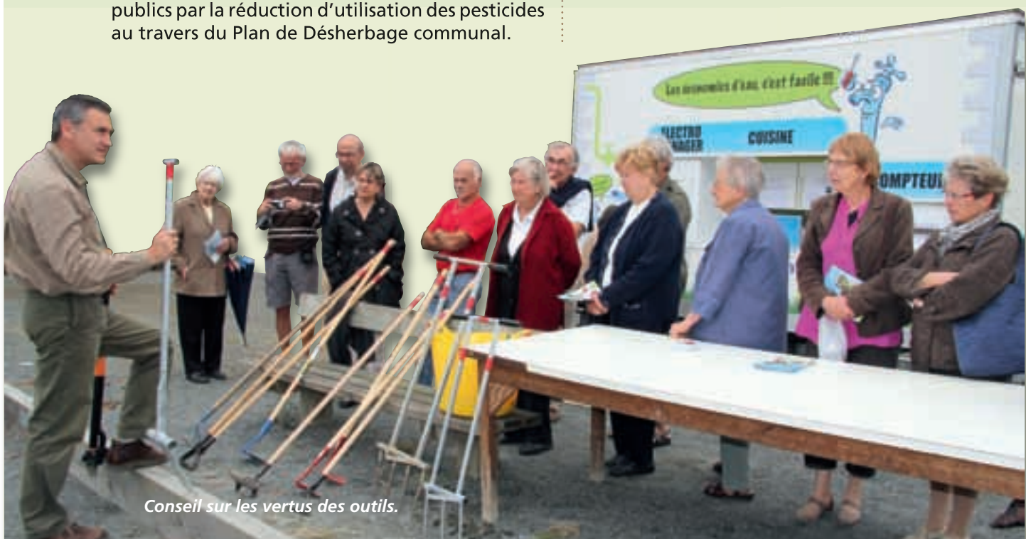
Conseil sur les vertus des outils.

Les services techniques de la commune et de la résidence de l'IF ont été très présents lors de cette journée pour montrer les différents types de paillage qu'ils utilisent, et expliquer les pratiques qu'ils mettent en place et qu'ils expérimentent pour que ces espaces de notre commune et de la résidence de l'IF soient beaux avec le moins de produits phytosanitaires possible.