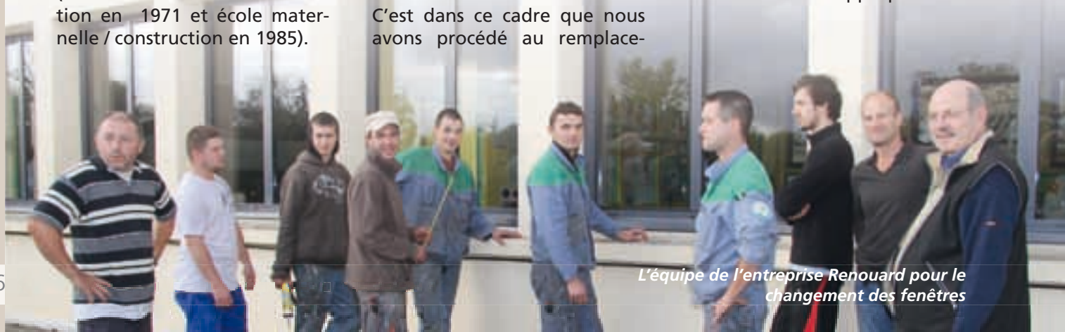
L'équipe de l'entreprise Renouard pour le changement des fenêtres

Enfin nous avons aussi réalisé l'installation de robinets thermostatiques sur tous les radiateurs en maternelle et une recherche de maîtrise de la régulation du chauffage par installation de sondes appropriées.