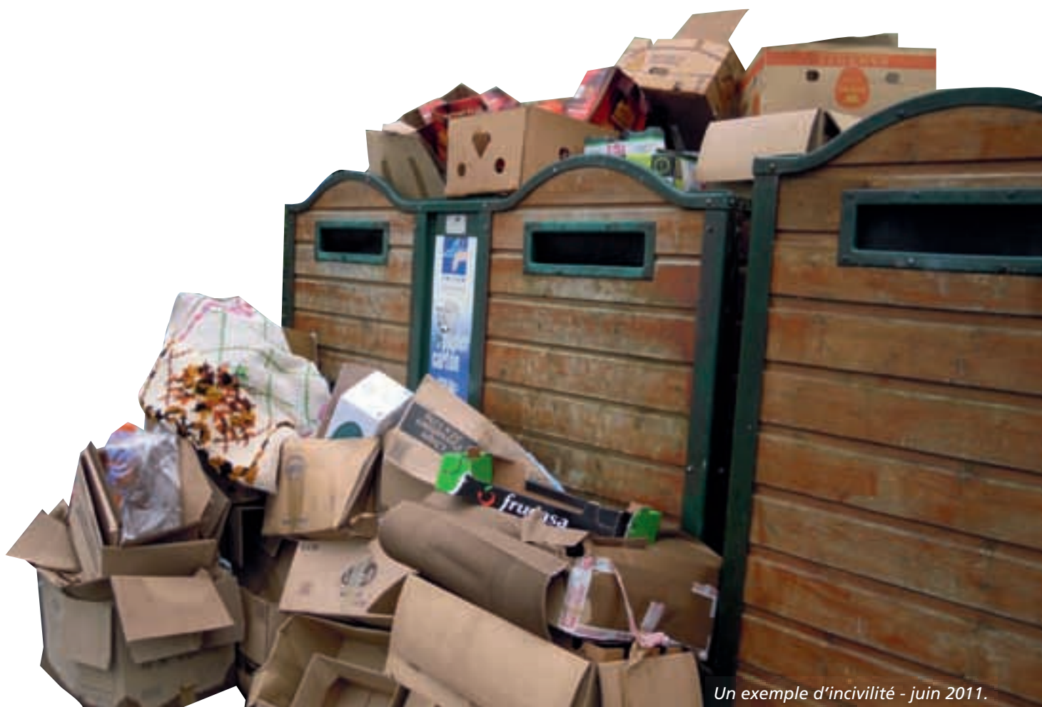
Un exemple d'incivilité - juin 2011.

Il est obligatoire pour les propriétaires d'arbres et de haies plantés en bordure de voie publique de procéder aux travaux d'élagage, de taille ou d'abatage si cela est nécessaire pour garantir la sécurité de tous. Soulignons que le défaut d'entretien constitue une infraction. L'élagage doit être réalisé de manière à ce que la végétation soit dégagée autour des réseaux aériens électriques, téléphoniques.