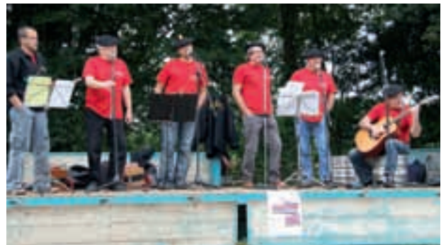
Une des animations à la fête du Folgoat.

L'assemblée générale de l'association aura lieu le samedi 2 juin 2012 dans la salle du folgoat.