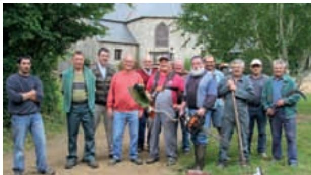
Toujours une bonne ambiance au Folgoat.

L'amicale du folgoat boucle actuellement le programme des fêtes des 7 et 8 juillet 2012.