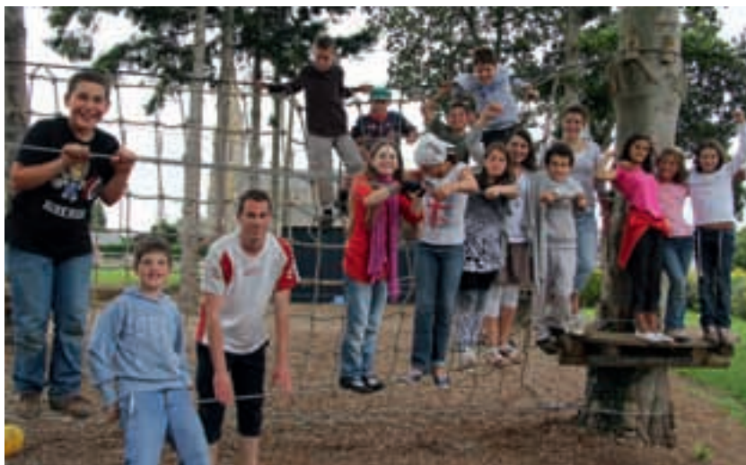
Sortie du CLSH au circuit du Faouët.