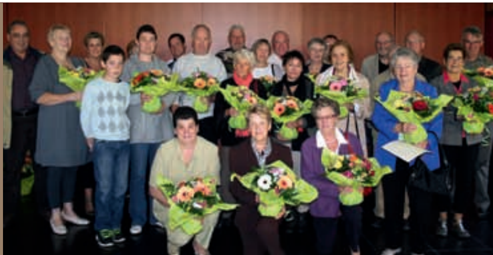
Remise des prix Maison Fleuries

En fait tout comme pour l'assainissement collectif, l'action citoyenne rend l'action publique plus efficace.