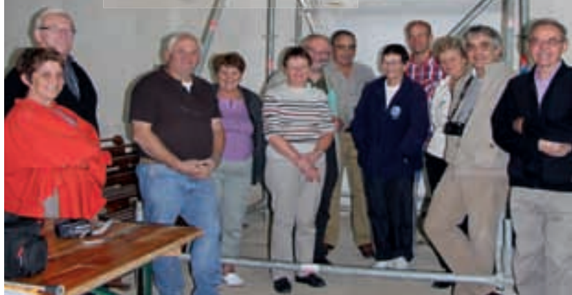
Réception du vitrail à la Chapelle du Paradis.