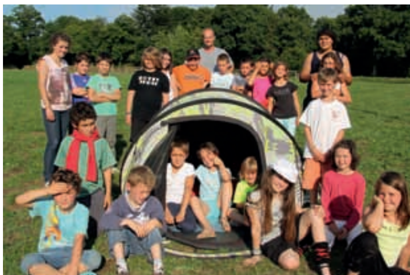
Camp au Centre de loisirs.

Il est donc demandé aux familles intéressées par l'ouverture du centre la semaine du 30/07 au 03/08 2012 de se faire connaître auprès de l'accueil de la mairie.