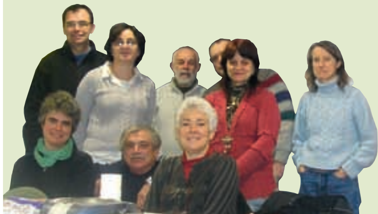
Une partie des élèves à Mammen

L'association Mammenn propose des cours de breton pour adultes, chaque jeudi soir au Centre Culturel Startijin.