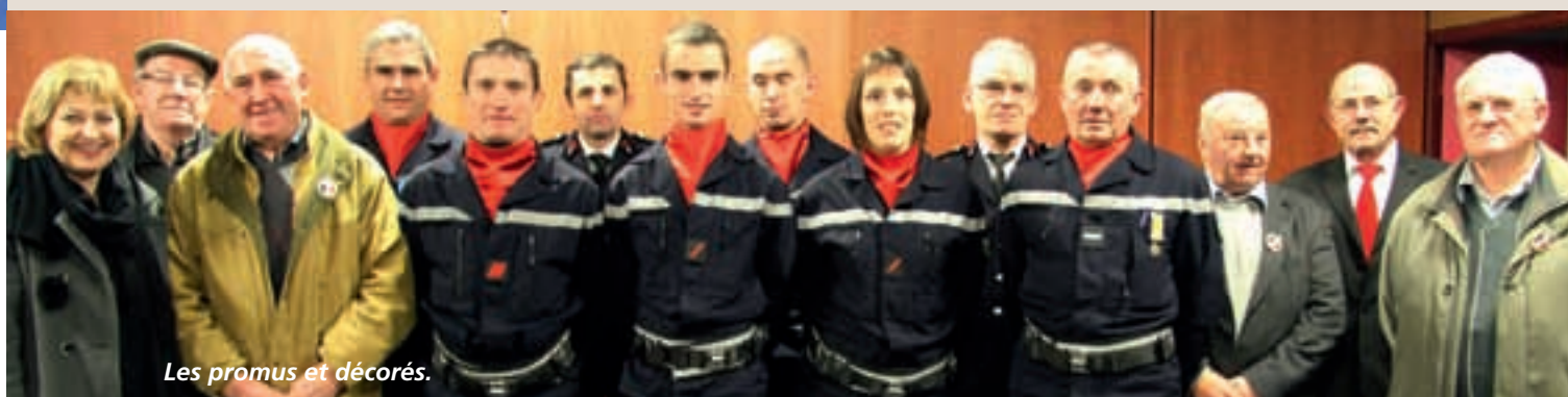
Les promus et décorés.