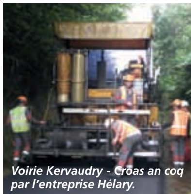
Voirie Kervaudry - Croas an coq par l'entreprise Héлары.

Concernant le programme voirie neuve pour l'année 2011, il a été réalisé le tronçon Kervaudry / Croas an coq, par l'entreprise HELARY, pour un montant de 43 054 € HT.