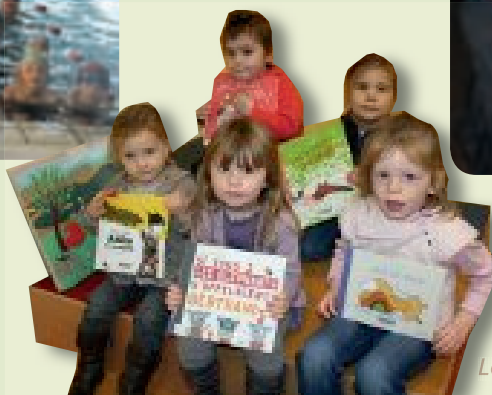
Les maternelles à la bibliothèque.