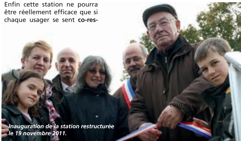
Inauguration de la station restructurée le 19 novembre 2011.

La présence d'hydrocarbure (résidus de peinture, de vernis, de solvants) est totalement à proscrire. Dans ce cas, pour ne pas altérer le traitement biologique, il faut solliciter une entreprise pour vidanger et traiter ces eaux impropres au traitement et cela représente un surcoût de 10 € environ par an et par abonné et ce pour chaque intervention de l'entreprise. Enfin l'unité de déphosphatation contient du chlorure fer-