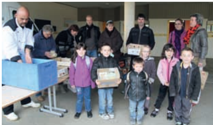
Une des actions de l'amicale laïque vente de repas.

La rentrée scolaire 2011 a vu les écoles maternelle et élémentaire publiques fusionner. Il n'y a plus qu'une seule direction assurée par Madame LE MAT. L'équipe pédagogique reste inchangée. L'école accueille 130 élèves répartis en 6 classes.