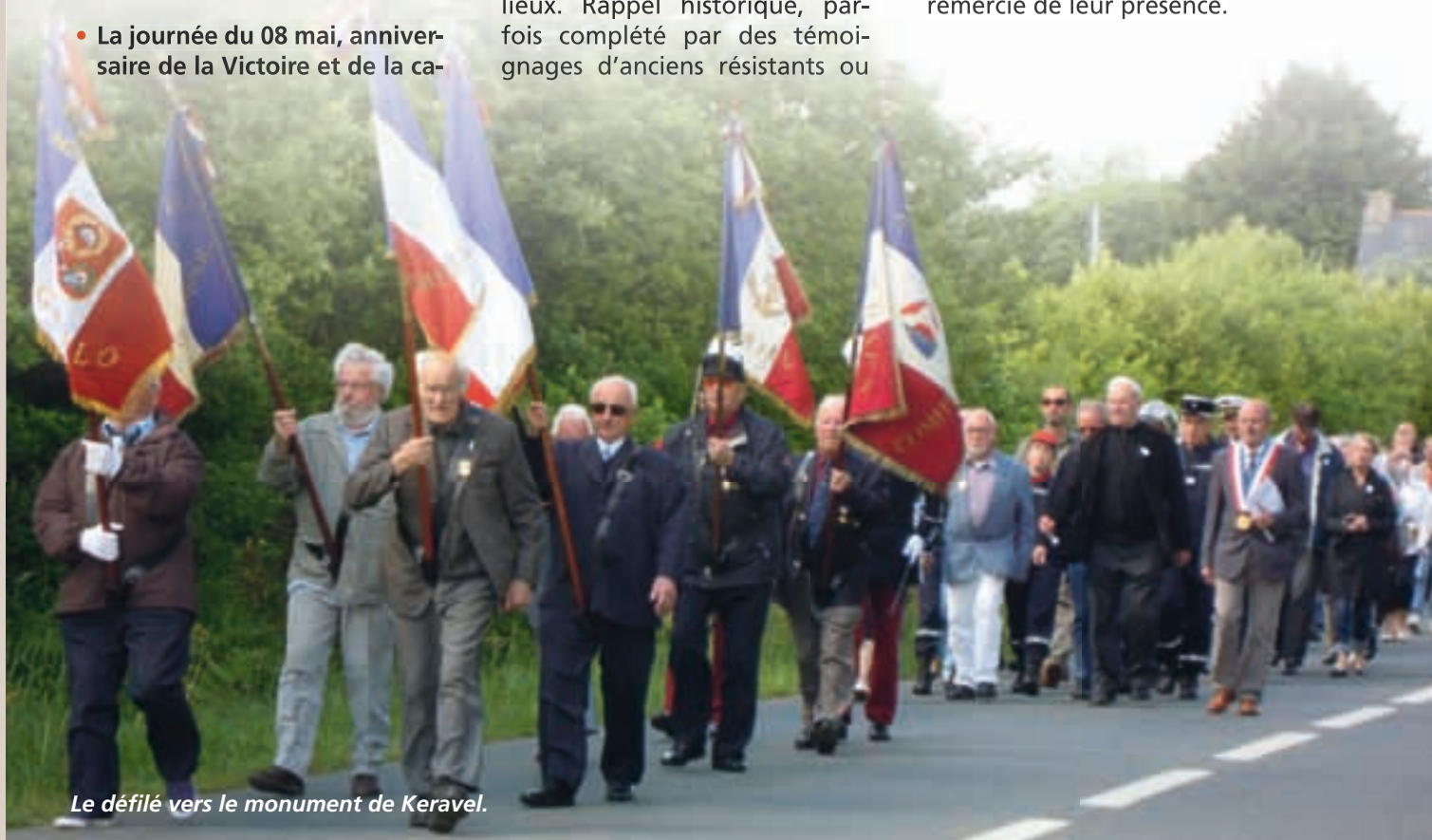
Le défilé vers le monument de Keravel.

En fonction des dates notons que pour certaines cérémonies, les directrices des écoles publique et St Anne nous accompagnent avec la présence d'élèves, qui permet ainsi de faire passer le message du souvenir et de mémoire aux futures générations. La municipalité les remercie de leur présence.