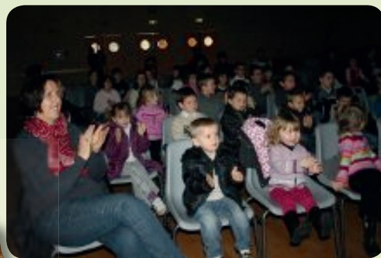
Spectacle offert par le comité d'animation de Pommerit-Le-Vicomte.