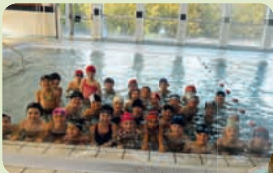
Les élèves CP CE CM à la piscine.