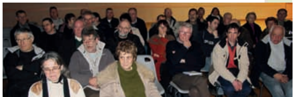
Réunion publique du 12 janvier.

Conformément à la loi sur l'eau du 06 janvier 1992, celle-ci impose aux communes d'assurer le contrôle des systèmes d'assainissement non collectif. Depuis le 1 er janvier 2004, l'ensemble des 15 communes du territoire de la communauté de communes Lanvallon – Plouha, a transféré cette compétence à la communauté de communes. Compétences et Missions qui sont assurées par le SPANC «Service d'Assainissement Non Collectif». C'est dans ce cadre que s'est tenue la réunion publique du 12 janvier 2012, animée par