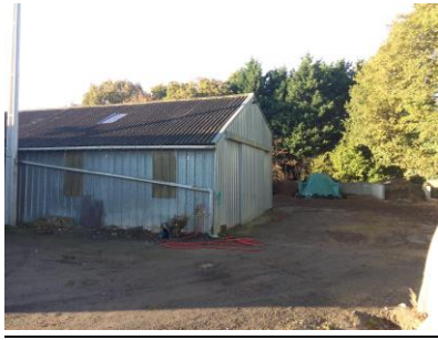
Vue avant travaux

Après plusieurs mois de travaux, pour certains complexes du fait du désamiantage, ce chantier est arrivé à son terme. L'équipe des services techniques y a fait quelques travaux de peinture et d'aménagement avant sa réintégration.