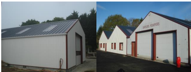
Vue après travaux : arrière et façade

Les pompiers ont eux aussi fait des travaux et repris possession de leurs locaux.