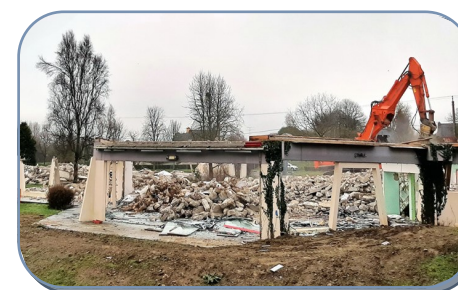
Les salles de restauration et de loisirs avant et après la démolition

Ce n'est pas sans un pincement au cœur et un sentiment de nostalgie que nous voyons ainsi disparaître un pan du patrimoine communal, qui fut pendant bien des années le lieu de vie et de travail de nombreuses personnes.