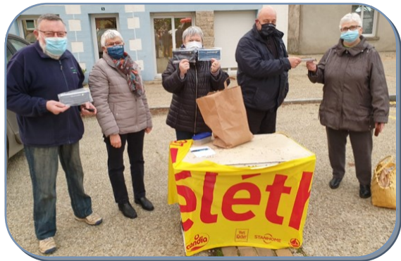
Les ambassadeurs du Téléthon au marché de la place du Centre afin de vendre des masques