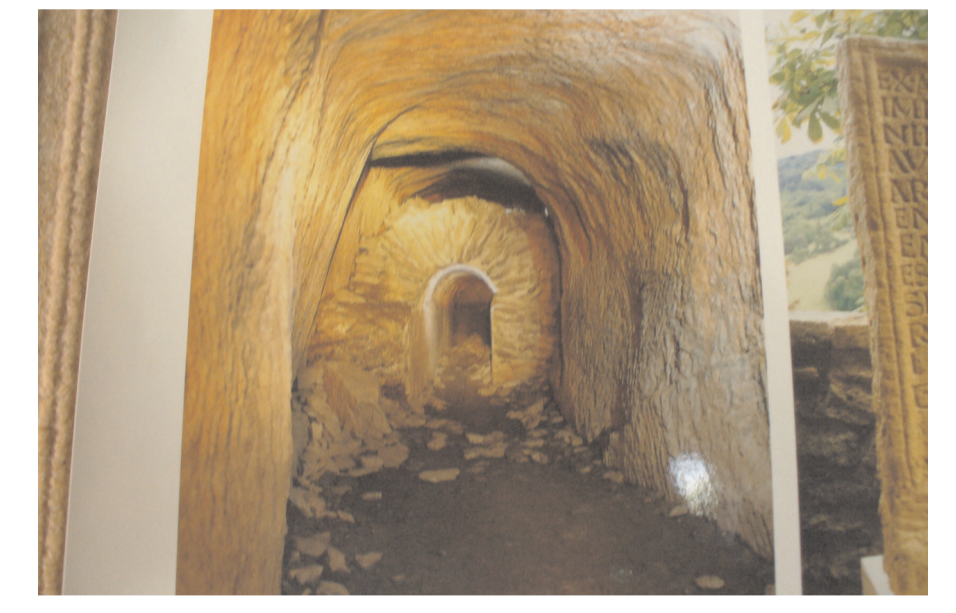
La cave du curé