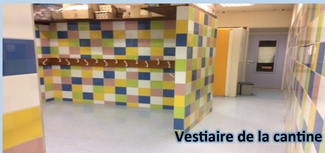
Vestiaire de la cantine de l'école refait en Août 2020 !!!

Au niveau des écoles, les vestiaires ont été rénovés. Décapage des moquettes murales pour laisser place à des murs carrelés, donnant un rendu haut en couleur.