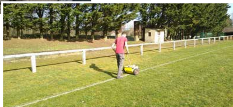
Tonte du stade, fertilisation et marquage.

Cette conception paysagère entre dans une démarche de développement durable à savoir le choix d'une palette végétale nécessitant un faible arrosage. Un paillage biodégradable à base de feutre végétal et du BRF (Bois Raméal Fragmenté) afin de réduire la levée des adventices et le maintien de l'humidité du sol.