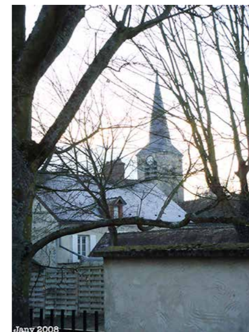
Point de vue du jardin en janvier 2008