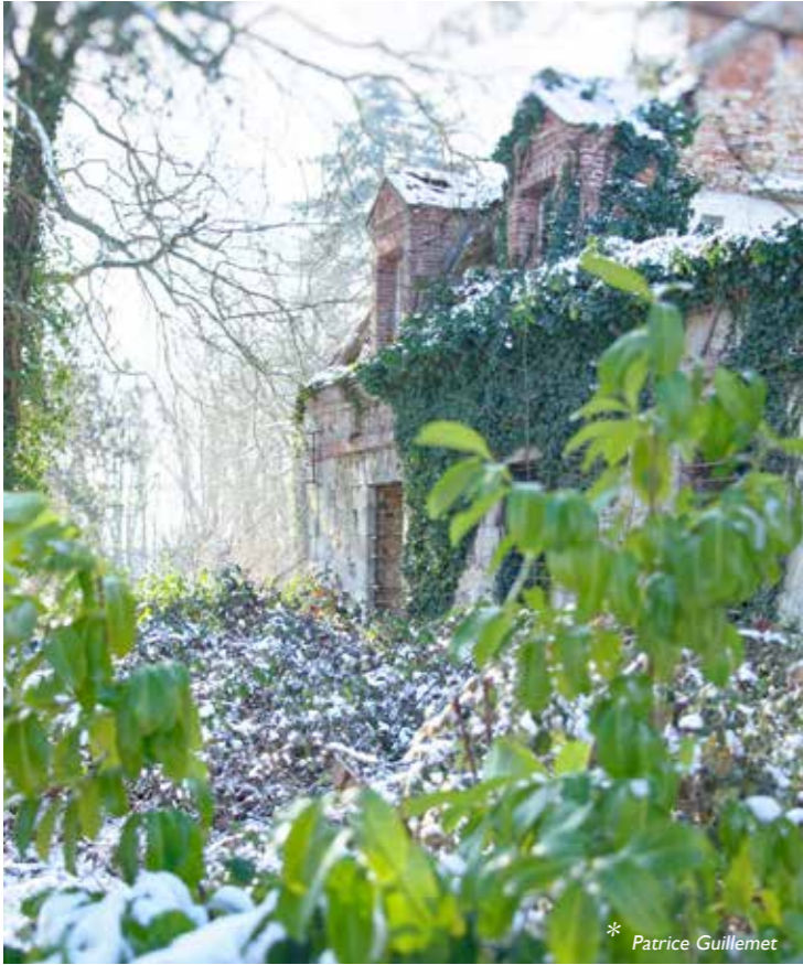
* Patrice Guillemet