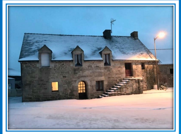
MAISON DANS LE BOURG