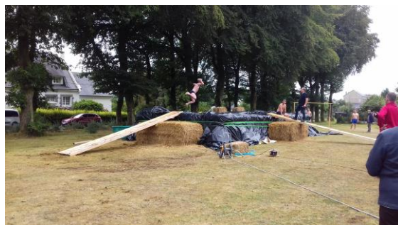
« jeux interclochers : saut dans la piscine » en 2018