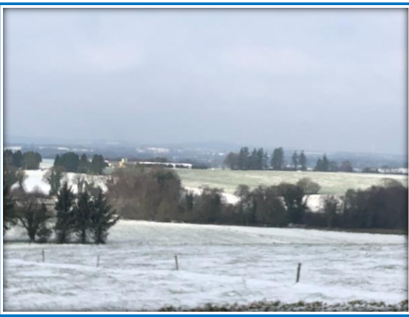
CAMPAGNE DE SEGLIEN