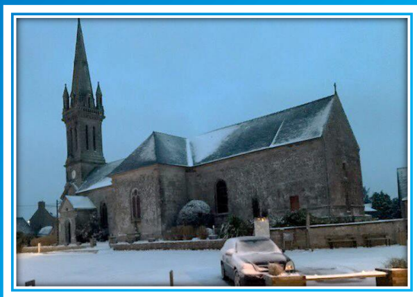
EGLISE NOTRE DAME DE LORETTE

La neige est tombée sur Séglien le 9 février dernier. Cela faisait 10 ans que ce n'était pas arrivé.