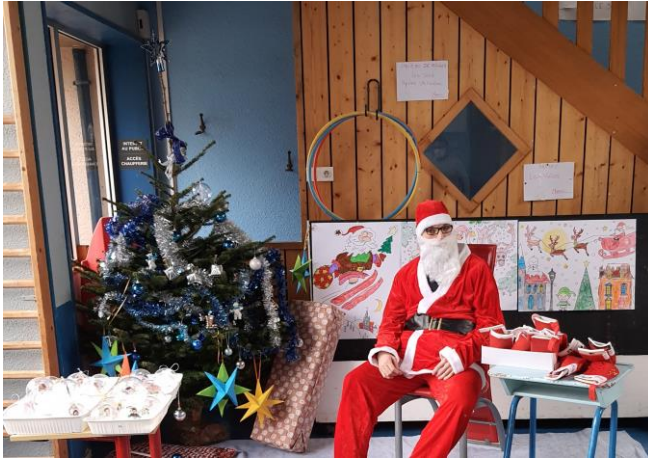
Le père Noël installé dans le hall de l'école