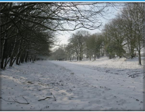
CAMPAGNE DE SEGLIEN