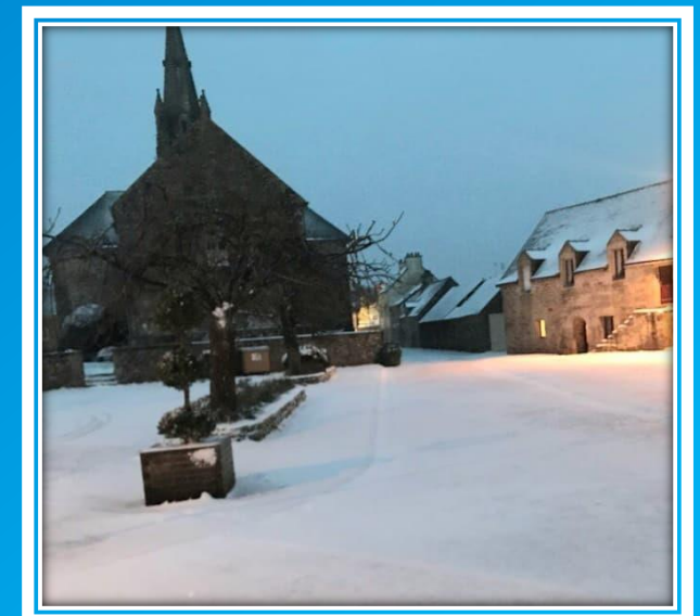
PLACE DE L' EGLISE