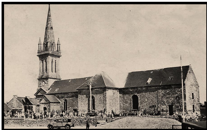
Eglise Notre Dame de Lorette

Pour rappel : messe dominicale à Séglien à 9h30 les 2, 3 et 4 ème dimanches du mois (ainsi que le 5 ème samedi à 18 h)