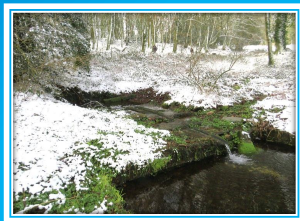
FONTAINE DE COET EN FAO