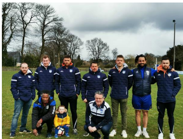
Une partie de l'équipe en tenue