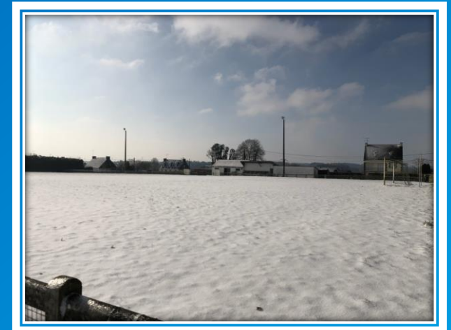
STADE DE FOOT