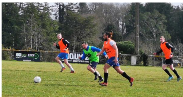
L' E.S. Séglien à l'entraînement