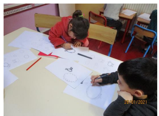
Les élèves de maternelle entrain de dessiner un mouton