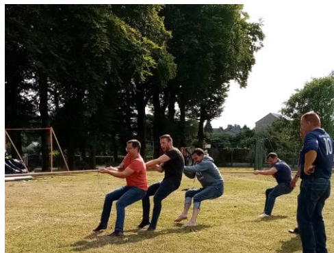
Tir à la corde des fêtes locales 2019