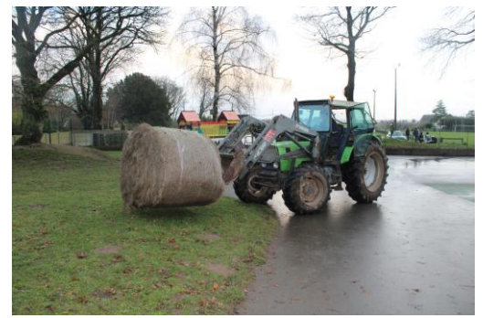
Le tracteur amenant le foin dans l'école

Les parents ont été sollicités pour des dons de graines, boutures et plants de fruits ou de légumes pour agrémenter le jardin de l'école et en faire un lieu de développement de la biodiversité. Au retour des vacances d'hiver, les petits jardiniers en herbe retrouveront le chemin de l'école mais aussi bien sûr celui du jardin.