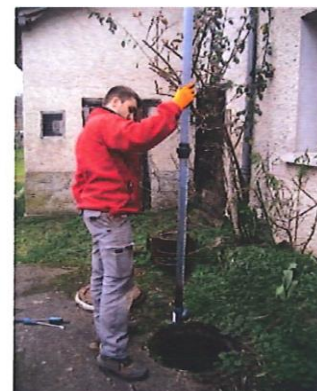
Mesure de boues d'une fosse septique

À la suite du contrôle, les techniciens établiront un rapport sur le diagnostic de l'installation comprenant un schéma des dispositifs d'épuration des eaux usées domestiques. Ils y joindront également un guide d'entretien et la liste des travaux à effectuer si nécessaire. Conformément au Code de la construction et de l'habitat, ce rapport doit être annexé à l'acte de vente en cas de transaction immobilière. Cette mesure, obligatoire depuis le 1 er janvier 2011, permet d'informer l'acquéreur de l'état du système d'assainissement.