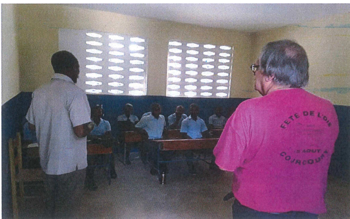
Le t-shirt de la Fête de l'Oie dans une salle de classe d'Haïti

Alain PHILIPPE – Président d'ELISA 8 impasse des Fleurs – Courcoury Mail : alainelisa@orange.fr Tél : 06 08 74 80 55