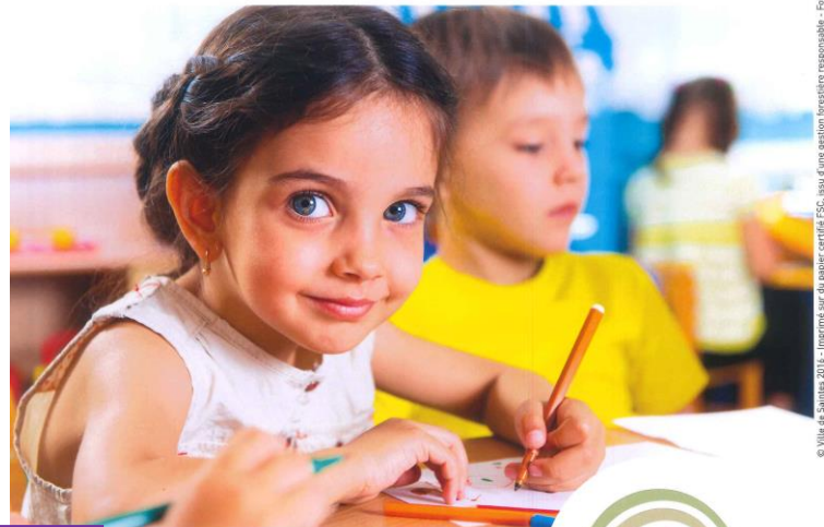
© Ville de Saintes 2016 - Imprimé sur du papier certifié FSC, issu d'une gestion forestière responsable - Fotolia