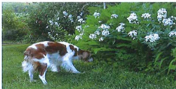
Tu vas sortir de là oui ?

Pour la plupart des chasseurs, chasse sous-entend chien ; du leveur de gibier, au retriever, en passant par les chiens d'arrêt ou les chiens courants toutes les catégories sont présentes sur notre territoire et sont indissociables de l'image populaire du chasseur,