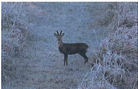
Je t'ai vu là !

Si bon nombre pratiquent diverses chasses et recherchent donc divers gibiers sédentaires ou non, un certain nombre de chasseurs s'est spécialisé au fil du temps, notamment sur le grand gibier (sangliers et chevreuils) ou sur le gibier d'eau (oies, canards, bécassines etc.), notre commune comportant des zones de marais boisées ou inondées favorables,