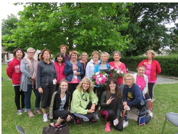
Groupe de gym juin 2016

Tous les derniers lundis du mois : step Essai gratuit, venez découvrir !