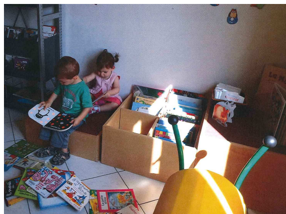
Atelier « bébés lecteurs »