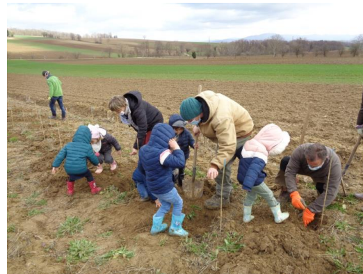
Los geht's! Busch in das Loch... mit Erde zudecken.