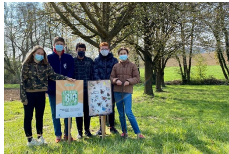
Carrés de la biodiversité