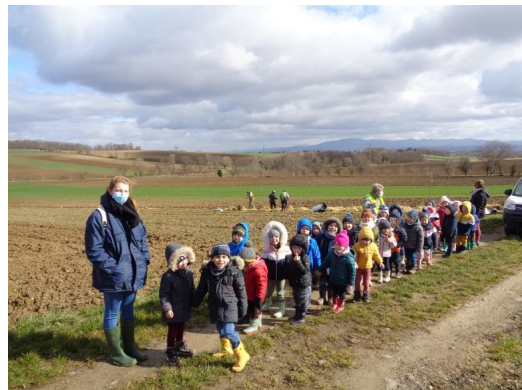
Danke für die Einladung! Wir haben ganz viele Sachen gelernt.