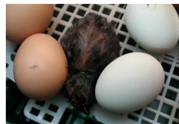
Das Küken ist endlich ausgeschlüpft, hurra!

Die PS-MS danken allen für ihre Teilnahme an diesen Projekt.