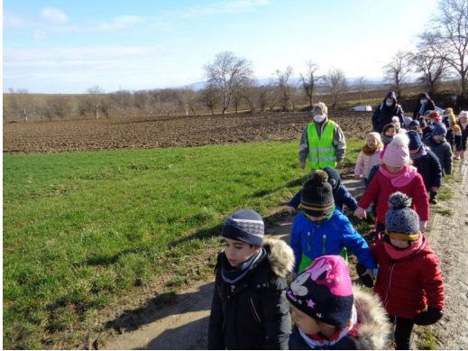
Erst 30 Minuten Laufen...

Freitag, den 12. März, haben wir, mit der Gemeinde von Koetzingue, Büsche gepflanzt: