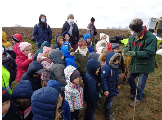
Dann entdecken wir die Büsche, die wir dann pflanzen werden.