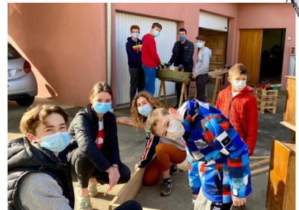
Hôtels à insectes