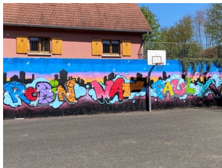
Graffitis au parking