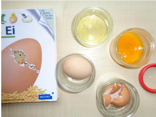
Das Ei entsteht im Bauch des Huhnes und besteht aus Schale, Eiweiß und Dotter.

Unser Projekt war, die Entwicklung von einem Ei bis zum Küken zu beobachten. Wir haben erst ganz vieles über die Hühner und Eier gelernt: