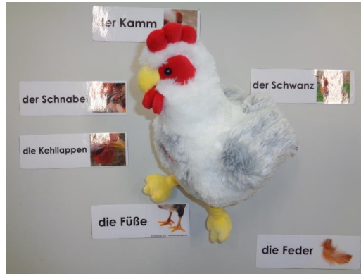
Die Körperteile von Frau Huhn.

Kommt ein Küken aus dem Ei, so hat der Hahn das Huhn befruchtet.