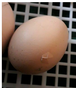
21. Tage später...