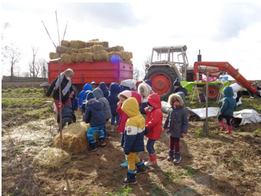
Dann ein bisschen Stroh darauf, damit der Busch nicht friert.