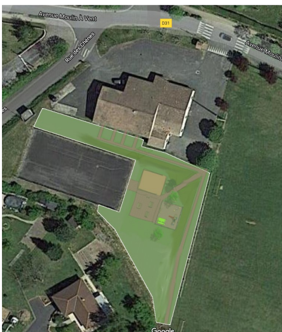
Vue de dessus

Des caméras de vidéo-surveillance seront installées afin de sécuriser les lieux et éviter les dégradations.