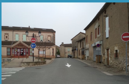
Le sens unique sur la rue des Remparts a été mis en place début 2021.