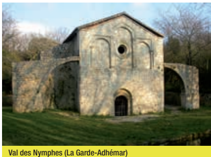
Val des Nymphes (La Garde-Adhémar)

perchés au site du Val des Nymphes. À proximité, le bâtiment d'une ancienne filature de soie du 19 e siècle est aménagé en galerie d'art contemporain. Continuer vers le village de La Garde-Adhémar en passant par le lavoir communal. En contrebas de l'église Saint-Michel, le jardin des plantes aromatiques et médicinales est en accès libre.