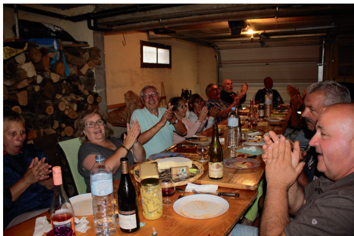
Repli en sous-sol lors de l'orage

Moment très prisé d'échange et de bonne humeur venant « récompenser » les membres de CVP de leurs participations aux travaux tout au long de l'année.