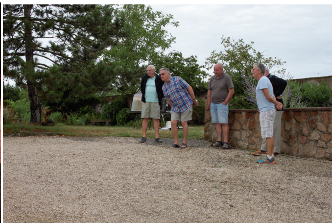
retour du soleil et des sportifs

Rappelons que cet instant privilégié est ouvert à tous les adhérents.