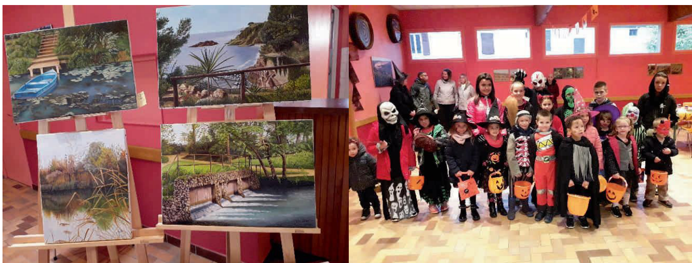
Les expos dans les granges