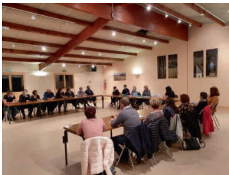
Assemblée Générale 07/10/20