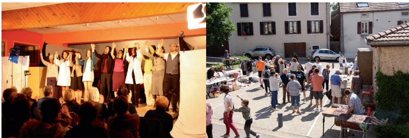
Le théâtre "en bonne compagnie"

Et pour patienter quelques photos de nos activités passées qui nous ont manquées.