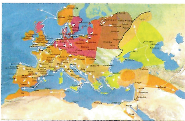
L'expansion de la peste noire au 14e siècle.

On estime que 24 à 34 millions de personnes sont mortes de la peste noire en Europe, soit plus du tiers de sa population.