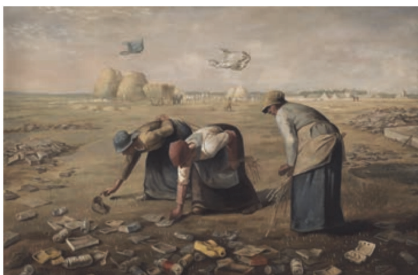
Œuvre inspirée du tableau Des glaneuses , de Jean-François Millet (1857).