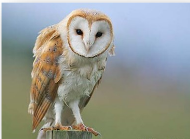
Effraie des clochers

L'Effraie des clochers a également été vue sur la Commune de PIMPRESZ