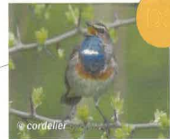
Gorgebleue à miroir