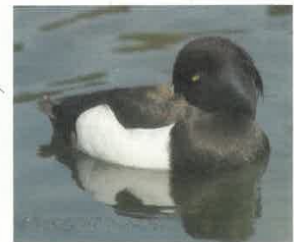
Hivernage Oiseaux d'eau