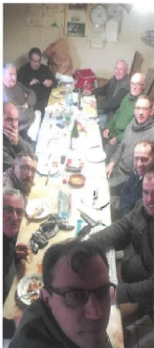
repas de chasse de Noël